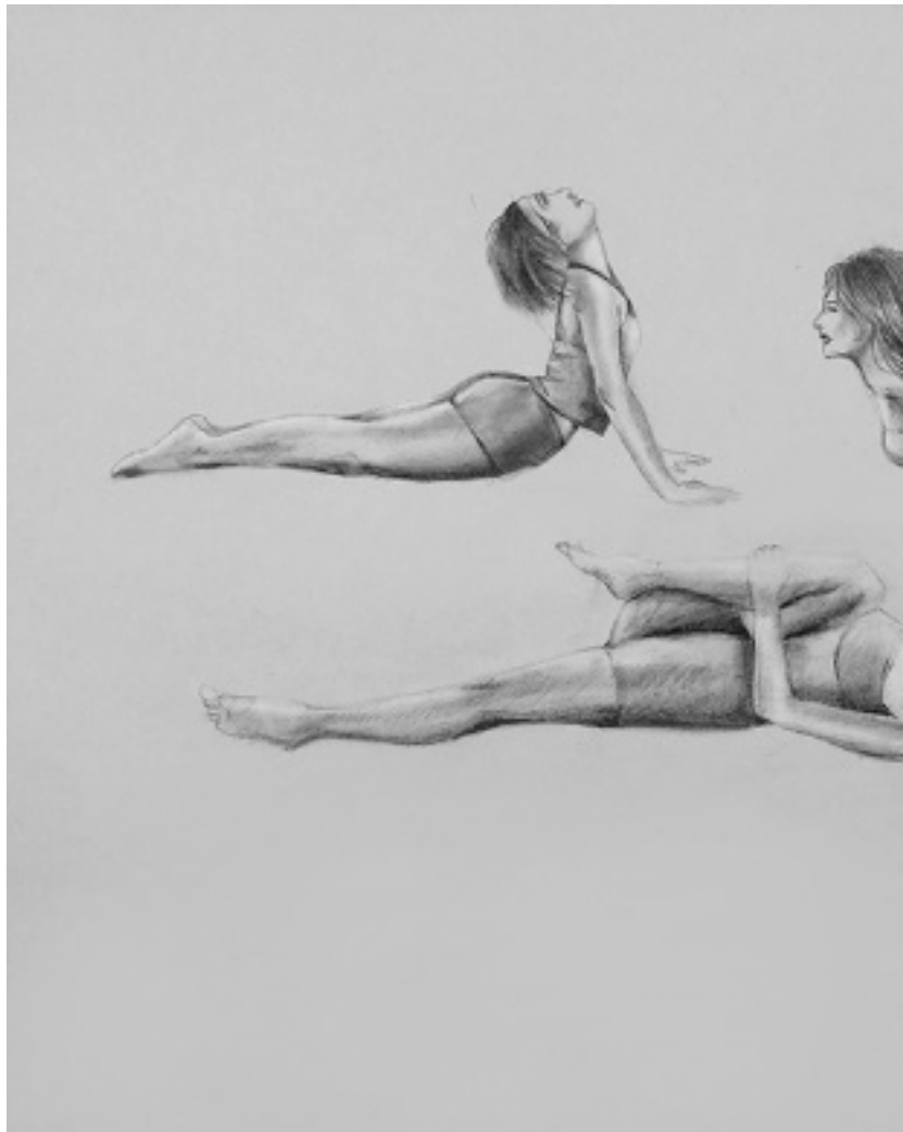
1.2.4. Завершение урока. Завершающим блоком можно