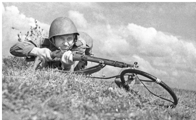
Сапер обезвреживает немецкую мину