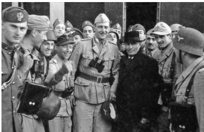
Отто Скорцени и Бенито Муссолини после операции «Дуб» по освобождению дуче

Другими словами, Отто Скорцени был двойным агентом... Это было бы обыкновенной шпионской историей, но многие исследователи утверждают, что по заданию американских спецслужб Скорцени специально передавал Израилю ложную информацию о местонахождении нацистских преступников... Возможно, именно поэтому долгие годы «Моссад» никак не мог поймать одного из самых разыскиваемых нацистов – врача-убийцу Йозефа Менгеле.