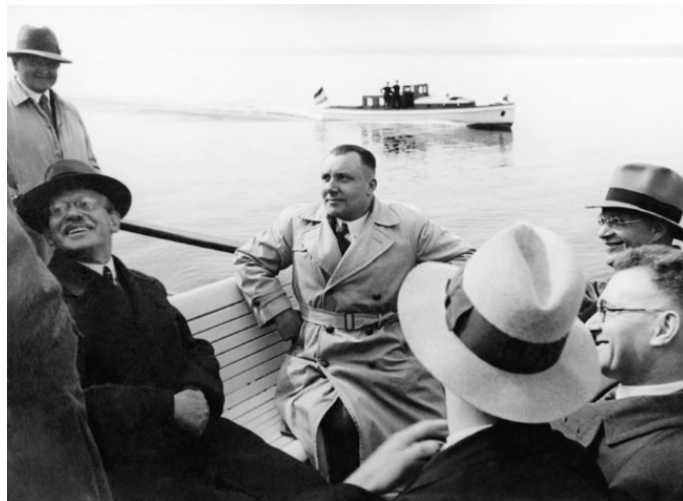
Мартин Борман – личный секретарь и ближайший соратник Гитлера

Внешне Мартин Борман был больше похож на безобидного провинциального бухгалтера, чем на одного из первых лиц Третьего рейха. Приземистый человек с приличным брюшком и головой, вечно втянутой в плечи. Всегда висящая мешком военная униформа. Заурядный образ дополнял бесформенный портфель, торчащий из-под мышки. Однако этого человека боялись все!