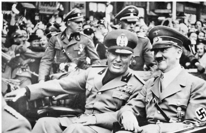
Бенито Муссолини и Адольф Гитлер, Германия

Очевидно, американские генералы оценили по достоинству способности самого известного нацистского диверсанта Отто Скорцени. Который затем, по некоторым данным, во время «холодной войны» готовил диверсантов против Советского Союза.