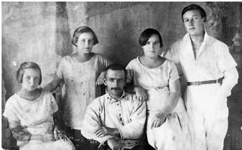
Борис Корнилов (справа) с семьей. 1928

праздника. «Песню о встречном» написали Борис Корнилов и Дмитрий Шостакович для фильма «Встречный» в 1932 году.