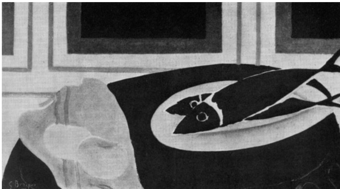
Жорж Брак. Чёрные рыбы. 1942

Разговора о его последних работах не получается. Сегодня он увозит их в Питер продавать.