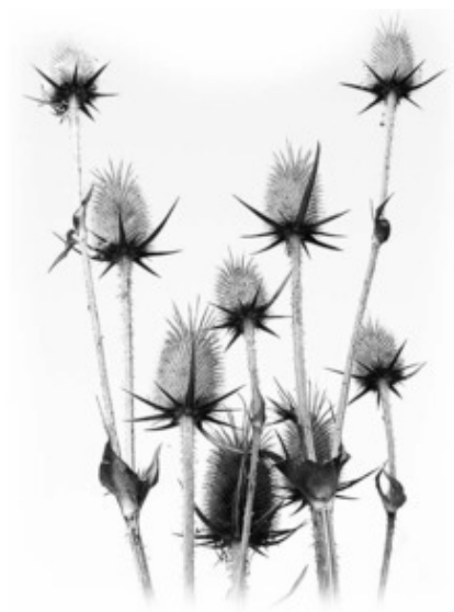
Dipsacus laciniatus L. (семейство Dipsacaceae)

Эту странную табличку отдали расшифровывать нашему выдающемуся лингвисту Вилли Мельникову, который был еще жив в ту пору. Этот уникальный лингвист знал более 100 языков, и из них половина древних и мертвых, а также таких экзотических, как клинопись или какие-то рисунчатые логомы Океании и китайских предгорий Тибета. Поскольку Вилли Мельников был по образованию еще и биолог, он определил, что за растение изображено на табличке.