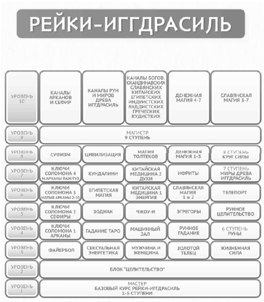
Рис. 2. Структура системы Рейки-Иггдрасиль