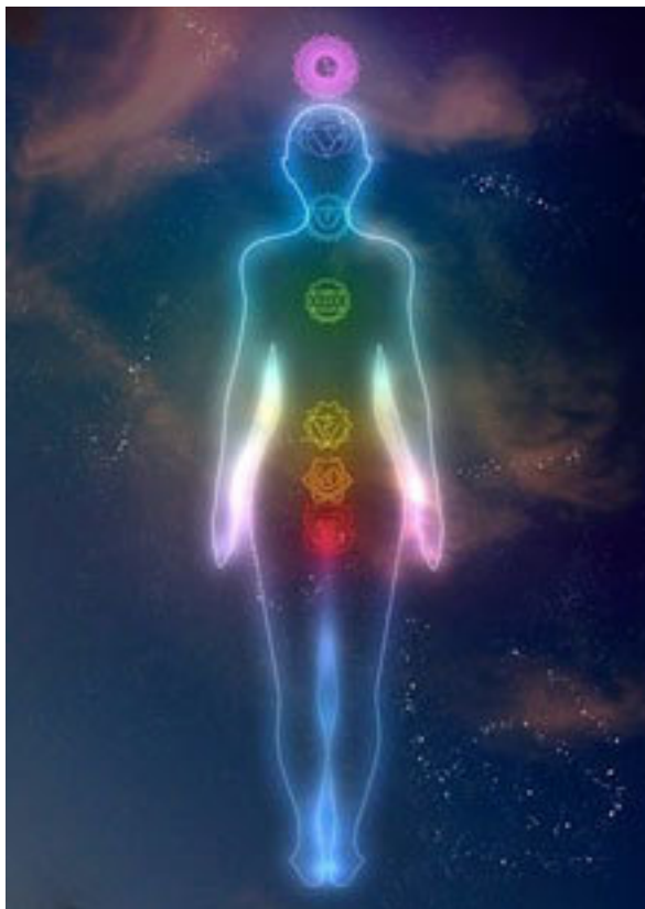
Рис. 4. Чакры

Весь блок «Целительство» базируется на традициях классической восточной медицины, в которой одну из главных ролей играют чакры – энергетические центры, отвечающие за функционирование всей энергосистемы человека в целом. На уровне физиологии чакрам соответствуют различные нервные сплетения, системы, органы и железы.