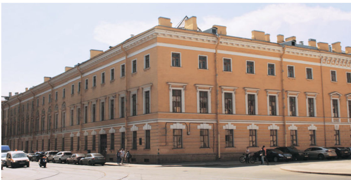
Здание ордонанс-гауза в Санкт-Петербурге

Как следует из военно-судного дела о дуэли Пушкина и Геккерн-Дантеса, на место поединка секунданты явились со своими дуэльными гарнитурами, каждый из которых состоял из пары пистолетов и принадлежностей к ним: «Пистолеты, из коих я стрелял, – показал на следствии Геккерн-Дантес, – были вручены мне моим секундантом на месте дуэли; Пушкин же имел свои». Таким образом, свой выстрел Геккерн-Дантес произвел в Пушкина из пистолета, входившего в дуэльный гарнитур, который привез д'Аршиак. Дуэльные правила допускали, что каждый из соперников по взаимному согласию мог использовать свои пистолеты, если различие в длине их стволов незначительно, а калибры тождественны.