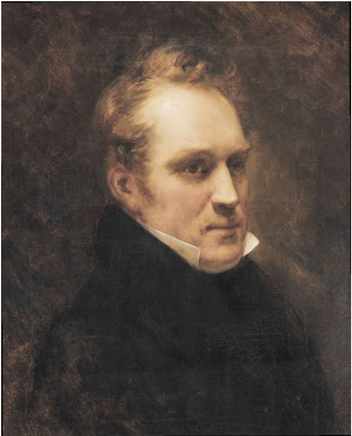
Отец Эрнеста де Баранта, Амабль Гийом Проспер Брюжьер де Барант

Из всех иностранных посланников он имел самые доверительные отношения с императором.