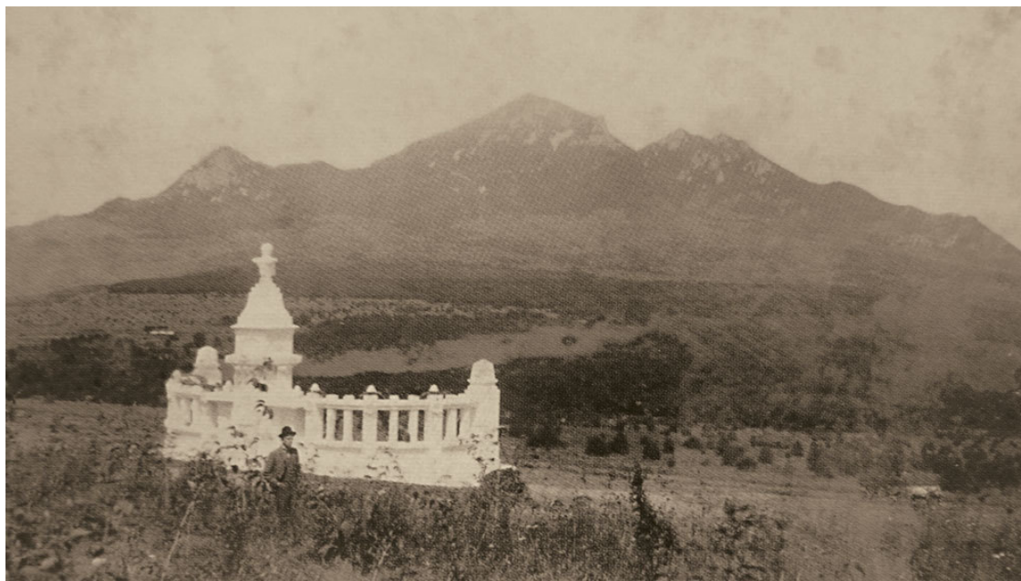
Памятник М. Ю. Лермонтову у подножия горы Машук фотография 1901 г.

В связи с этим при подготовке настоящей книги к изданию, исходя из письменных источников, была предпринята попытка установить наиболее вероятное место дуэли. После чего, по просьбе автора, специализированная организация – ОАО «Северо-Кавказское аэрогеодезическое предприятие» – на картографической основе Росреестра изготовило топографическую карту, на которой отображен участок местности – вероятный район действительного места дуэли Лермонтова. Следуя ориентирам, указанным на данной топографической карте, прилагаемой к настоящему изданию, а также учитывая особенности ландшафта, можно с большой долей вероятности определить, где проходила дуэль.