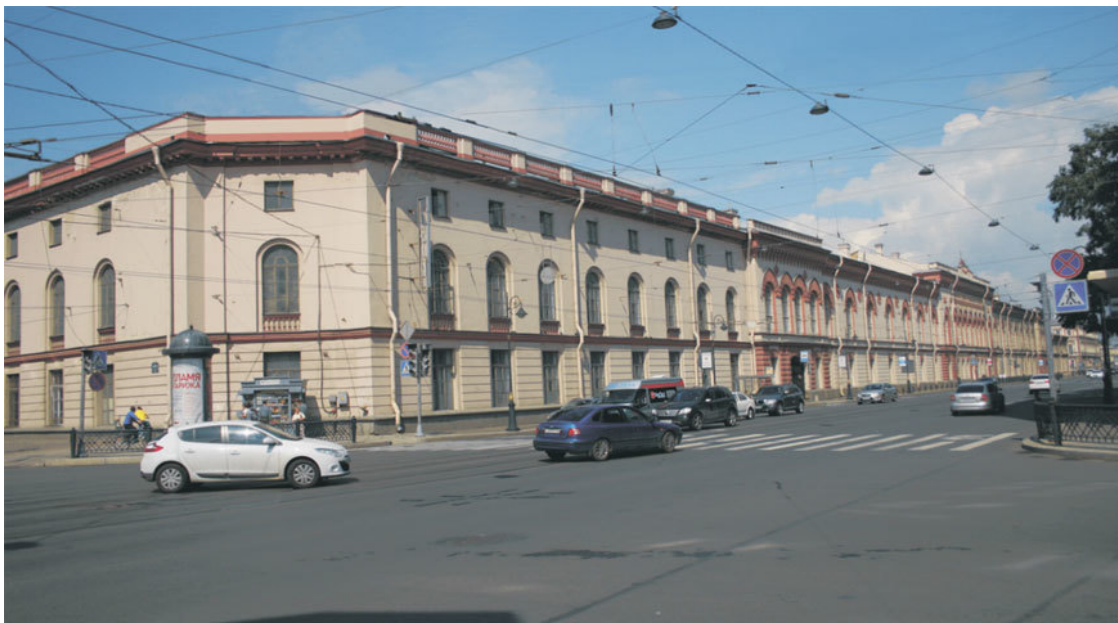
Здание Арсенальной гауптвахты в Санкт-Петербурге

Комплекс зданий Арсенальной гауптвахты сохранился; в наше время в нем располагались Военная прокуратура, Патронный завод (Санкт-Петербург, Литейный проспект, дом 3; улица Шпалерная, дом 19; улица Чайковского, дом 14).