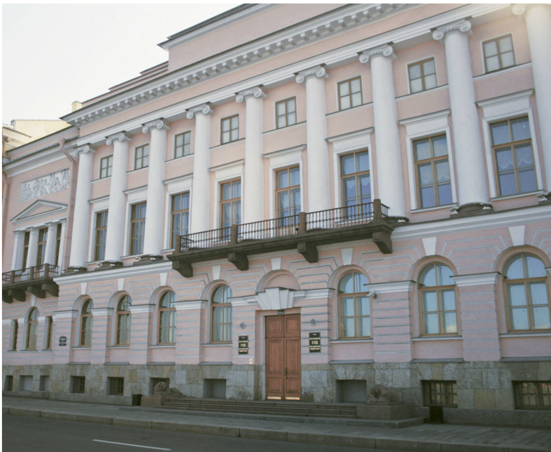
Дом Лавалей в Санкт-Петербурге

Впечатления от балов в доме Лавалей Пушкин выразил при описании бала в романе «Евгений Онегин».