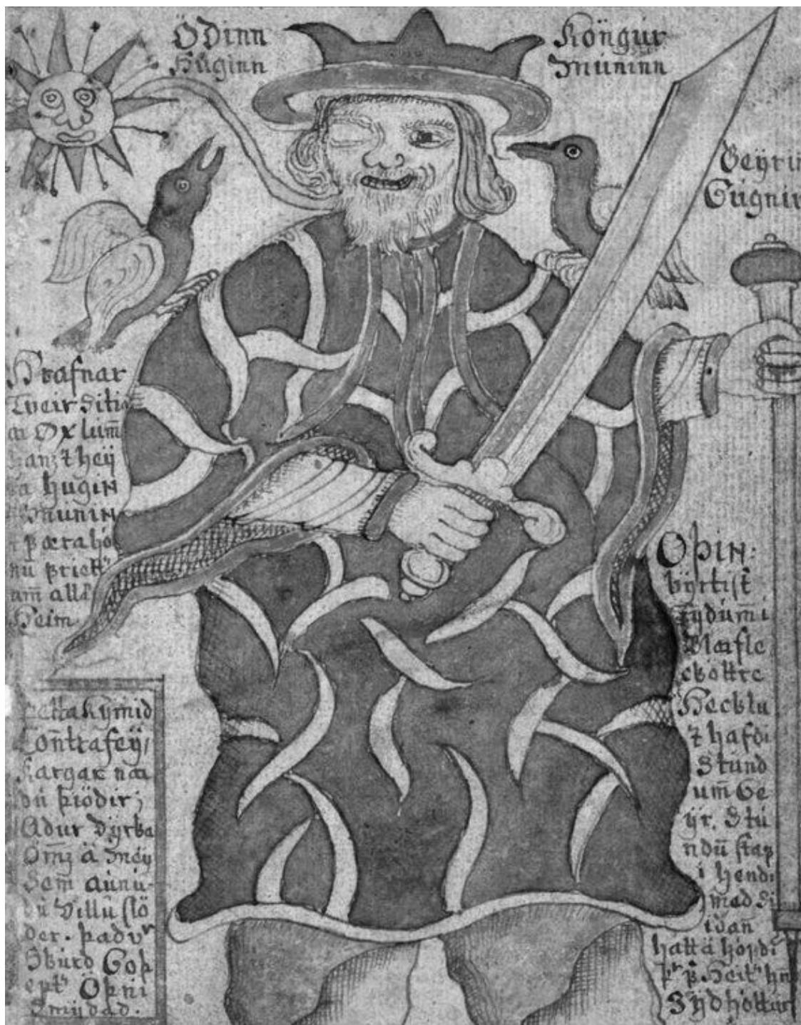
Рис. 2. Один. Иллюстрация из исландской рукописи XVIII века

Но нет ли какой-нибудь более «приземленной» версии происхождения рун? Долгое время историки и филологи отталкивались от их странной формы – угловатой, геометрической, и старались найти аналоги в самых разных древних языках. Но впоследствии возникла гипотеза, что, возможно, «предки» германских рун выглядели несколько иначе, просто жители севера трансформировали какую-то из существовавших на тот момент письменностей так, чтобы буквы (знаки) было удобно вырезать на камне и дереве. Поэтому руны, какими бы они ни были изначально, приобрели характерную угловатую форму. Наиболее популярна в наше время версия о происхождении рун от какого-либо из северноэтрусских алфавитов. Есть также