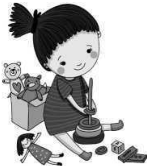
Иллюстрация на переплете Alexandra Dikaia