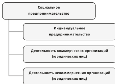
Рис. 1.2. Типология социального предпринимательства: правовой аспект

нужды школы. Однако подобные проекты находятся на периферии развития СП в Российской Федерации и в данном пособии специально не рассматриваются.