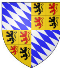
Герб Геннегау (Эно)

– Спасибо, Отец, – прошептал Симон, – Теперь он мой. Мой первый по- настоящему крупный алмаз. И теперь он мой навсегда!