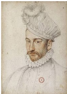
Портрет Карла IX. Худ. Франсуа Клуэ.

– Суррогат, – пояснил он. – Полное ничтожество. Стоит взглянуть на его портрет, сделанный Франсуа Клуэ 29 , и все станет ясно. Удивительная верность натуре! Кстати, Карл тогда сидел у окна Лувра и развлекался тем, что стрелял в прохожих из мушкета. Такие вот милые забавы дитяти. Это было на противоположной от нас, восточной стороне Лувра, напротив церкви Сен-Жермен-л'Осеруа.