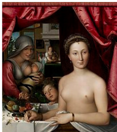
Диана де Пуатье