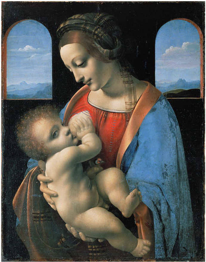
«Мадонна Литта». Эрмитаж, Санкт-Петербург. Худ. приписывается Леонардо да Винчи, но предположительно Дж.-А. Больтраффио.