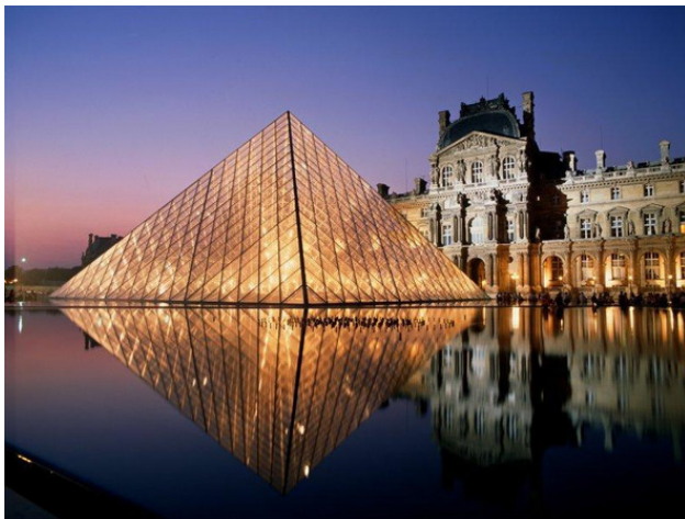
Пирамида Лувра (Пирамида Пэя). Арх. Йо Мин Пэй.

но. Но, главное, пирамида Пэя уже стала частью Парижа – неотъемлемой частью. Как Эйфелева Башня или Центр Помпиду. Париж принял их, это факт. Париж – вообще удивительный город: он каким-то непостижимым образом, как бы это сказать, – «инкорпорирует», то есть, включает в себя, самые порой неожиданные элементы. Если можно так выразиться, «опариживает» их, так что они «врастают» в его ткань.