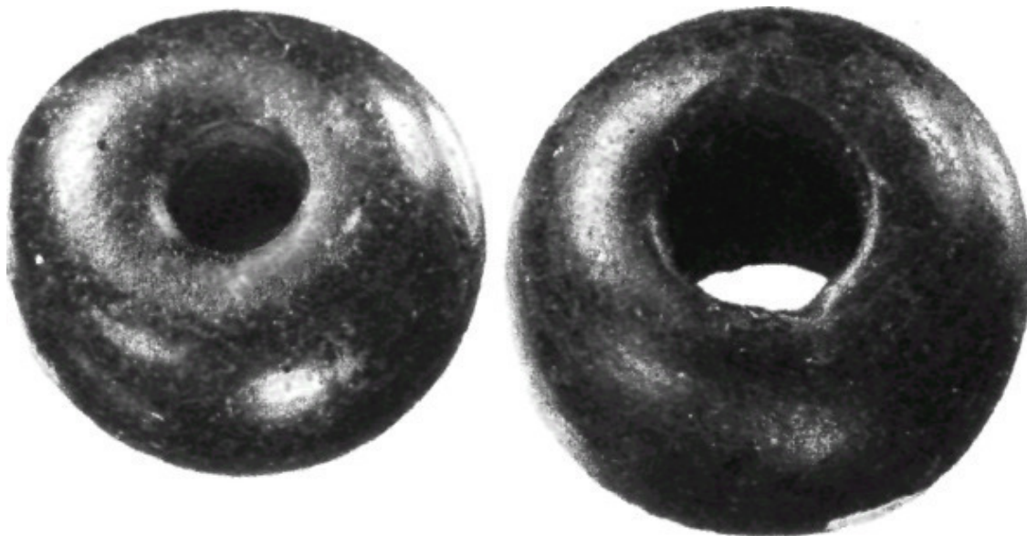
Бусинки из голубого кобальта

3 Всякое место, на которое ступят стопы ног ваших, Я даю вам, как Я сказал Моисею: (Обещание захвата территорий. Торговые связи между Древним Египтом, Месопотамией и Скандинавией существовали ещё в бронзовом веке, 3100—3400 лет назад. Таков вывод датских археологов, проанализировавших химический состав бусинок из голубого кобальтового стекла, найденных в десяти захоронениях этого возраста. Судя по составу микроэлементов в стекле, часть изделий происходит из Египта, часть – из Месопотамии. До сих пор египетское стекло не находили севернее Средиземноморья, а стеклянные изделия из Вавилона или Ниневии не обнаруживали севернее Франции. Предполагают, что в обмен скандинавы поставляли балтийский янтарь).