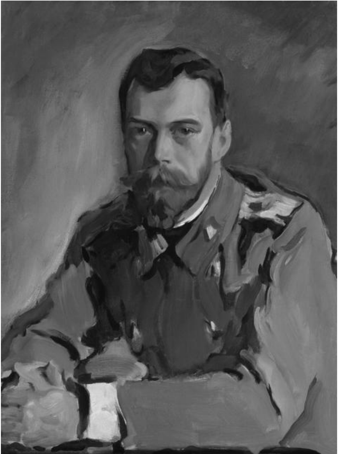
Портрет Николая II. Худ. В.А. Серов