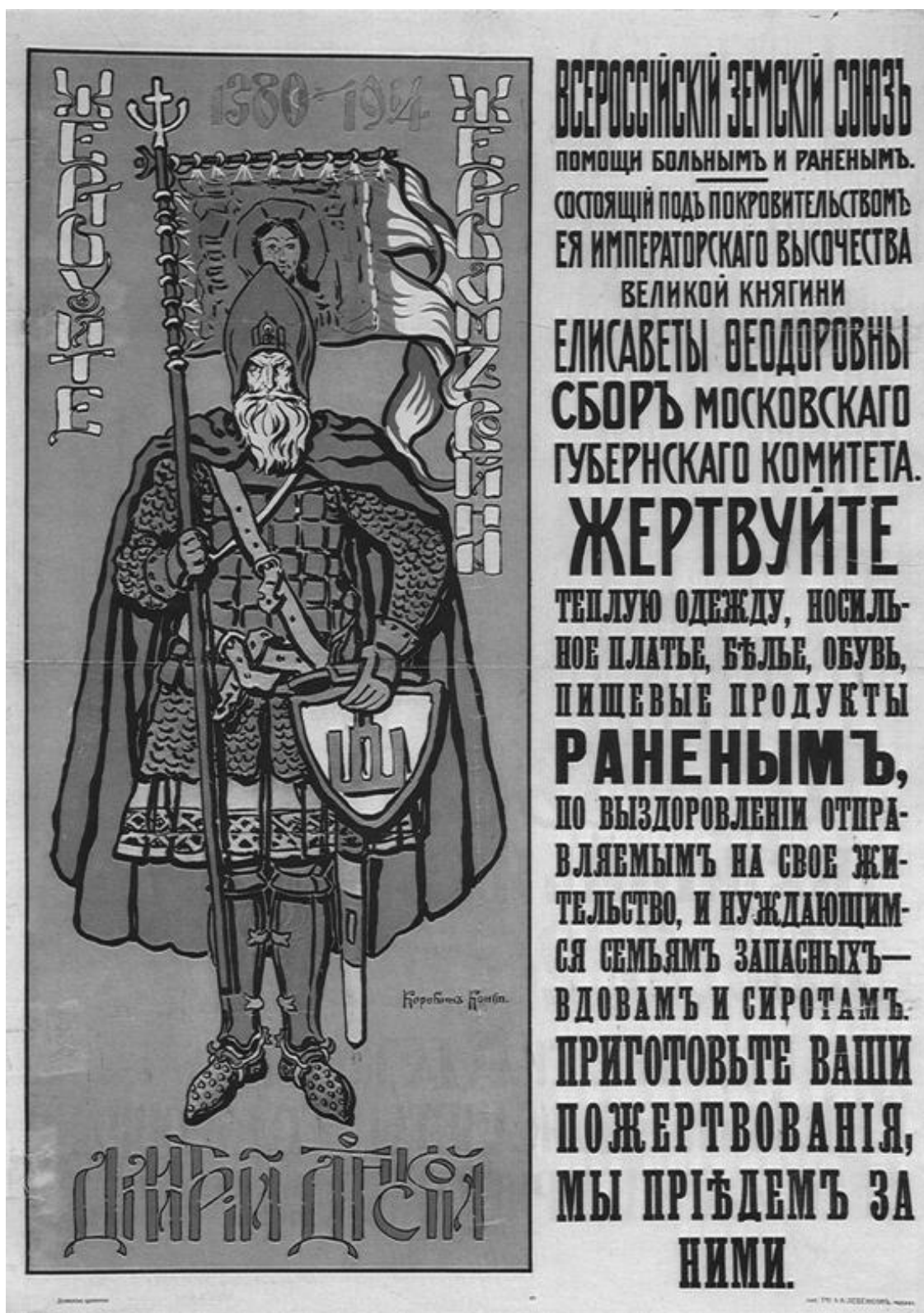
Плакат Всероссийского Земского союза. 1914 г.

Таким образом, с этого момента требование «министерства доверия» стало девизом грядущего переворота, призванного отнюдь не перераспределять полномочия между монархом и народным представительством в пользу последнего, а окончательно свергнуть царскую власть. Монархии при этом, в лучшем случае, отводилась роль изящной исторической декорации;