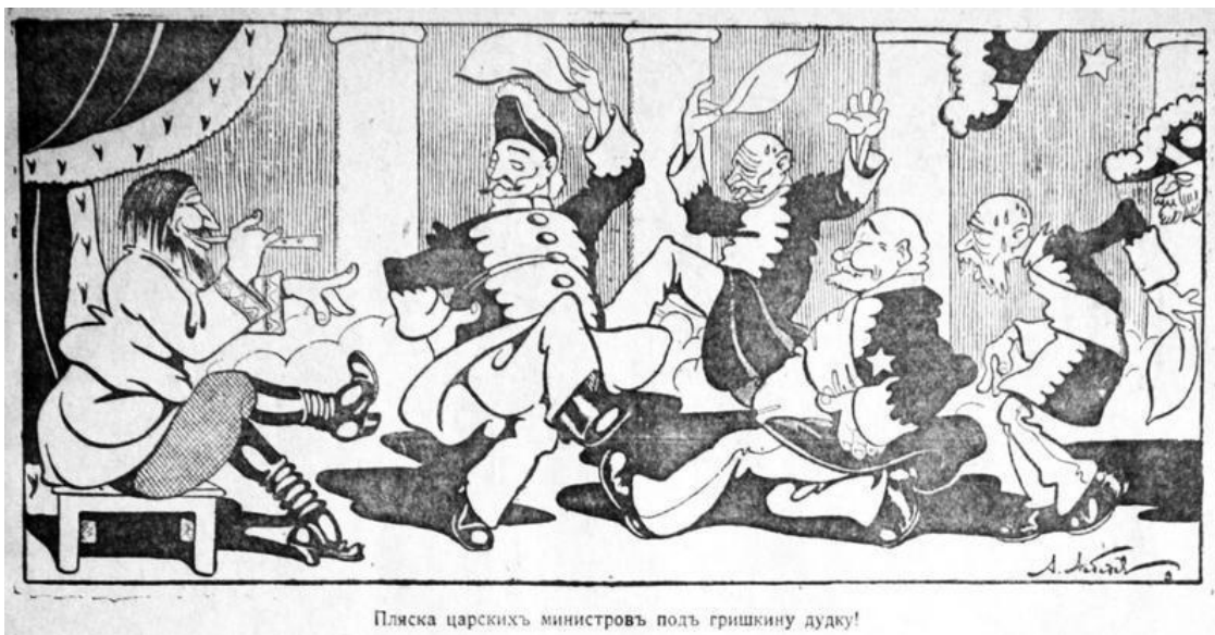
Пляска царскихъ министровъ подъ тришкину дудку. Карикатура