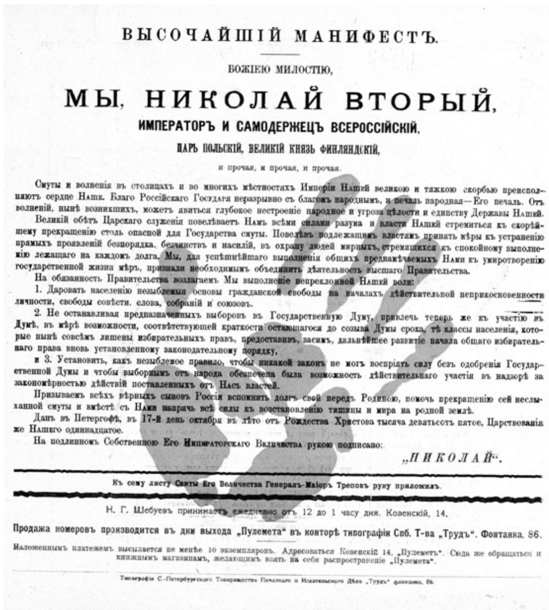
«Манифест 17 октября 1917 г. с отпечатком кровавой руки генерала Трепова. Карикатура. Худ. И.М. Грабовский. 1905 г.

Но альянс октябристов с кабинетом П.А. Столыпина носил временный и тактический характер. В отличие от революционеров и левых либералов – кадетов, октябристы добивались неуклонного осуществления буржуазных реформ «сверху», гарантирующих права собственности и неизбежность конституционных основ государственного строя, и лишь затем намеревались вступить в борьбу за политическую власть – за право формировать «ответственное министерство» и руководить его работой. Как «умеренная, строго монархическая партия», они официально декларировали только легальные формы политической деятельности, но, в исключительных случаях, допускали и более радикальные методы, хотя предпочитали говорить о них лишь в узком кругу. В публичных же речах для обозначения крайних намерений традиционно использовался «эзопов язык» во всем богатстве его намеков и двусмысленностей.