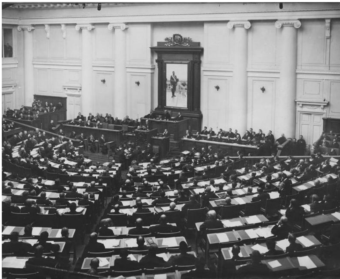
Заседание IV Государственной думы 5 декабря 1912 г. На трибуне – председатель Совета министров В.Н. Коковцов

После крупного политического скандала вокруг дела о введении земств в западных губерниях и убийства Столыпина правящий кабинет потерял поддержку думского большинства. В избранной осенью 1912 г. четвертой Думе, несмотря на, казалось бы, незначительные перемены в партийном составе депутатского корпуса, оппозиционность законодателей кардинально возросла. Сменивший Гучкова на посту председателя Думы другой октябрист – М.В. Родзянко выступал за «укрепление конституционного строя». Думцы вели борьбу против влияния «темных сил» в лице Распутина и вмешивались во внешнюю политику царя, требуя вступления России в войну против Турции на стороне Балканского союза; а единственным возможным условием компромисса с царской властью считали создание «ответственного министерства».