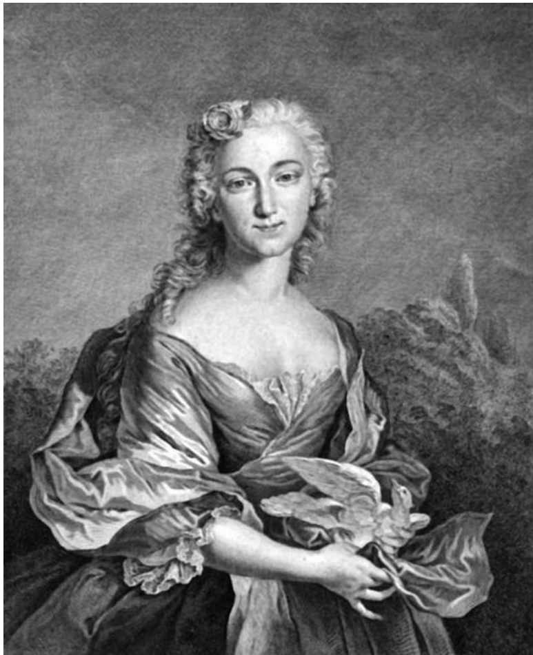
Портрет Мари Салле. Неизвестный художник. 1730-е гг. Мари Салле (1707–1756) – французская артистка балета