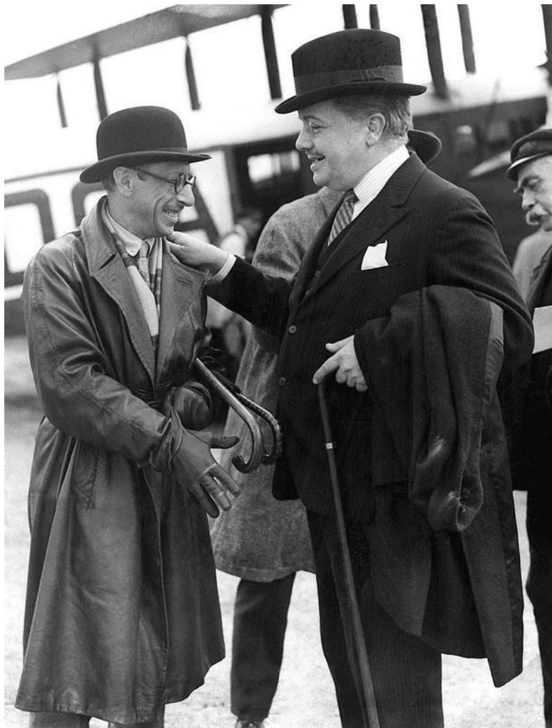
Игорь Стравинский и Сергей Дягилев в аэропорту Лондо-