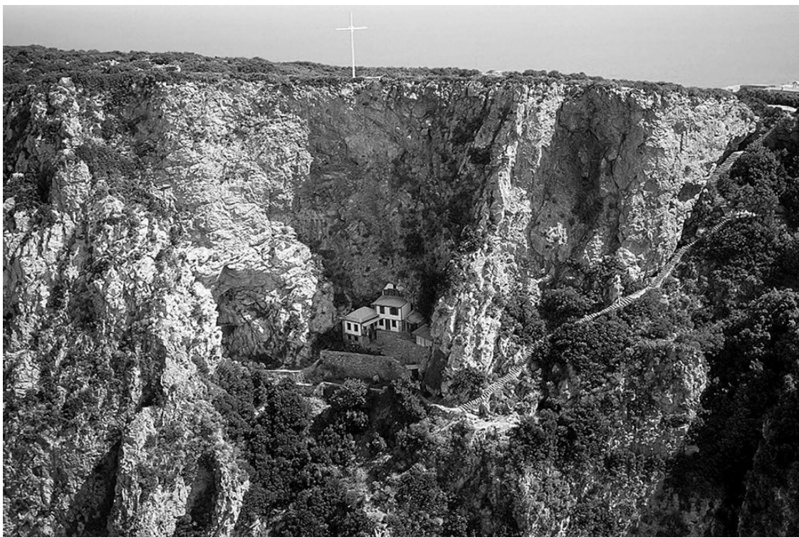
Пещера прп. Афанасия Афонского