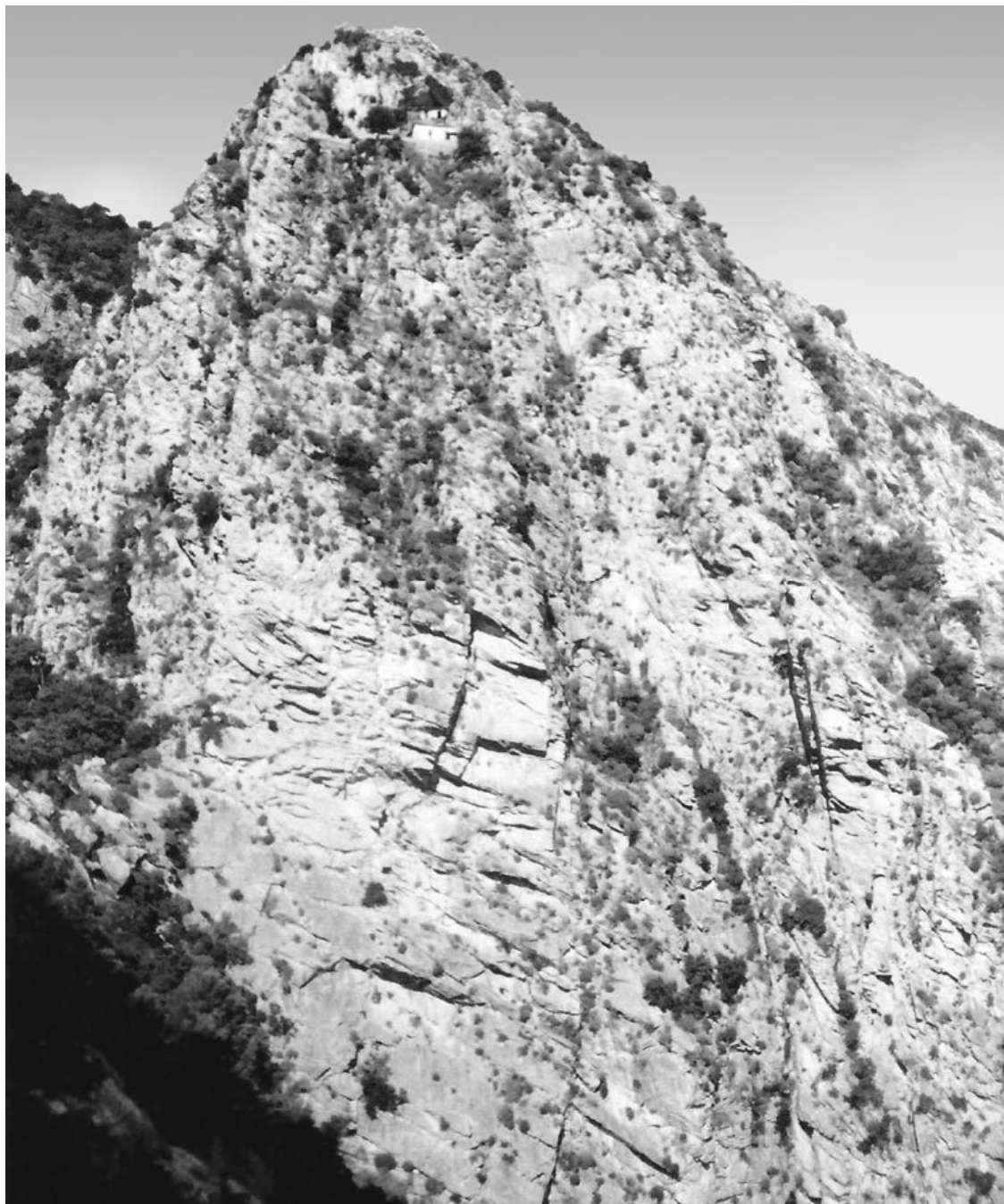
Пещера при. Нила Мироточивого