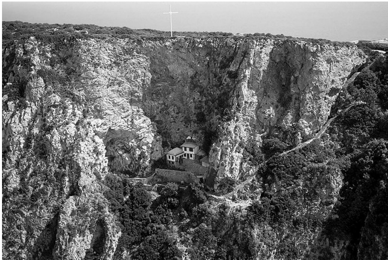
Пещера при. Афанасия Афонского