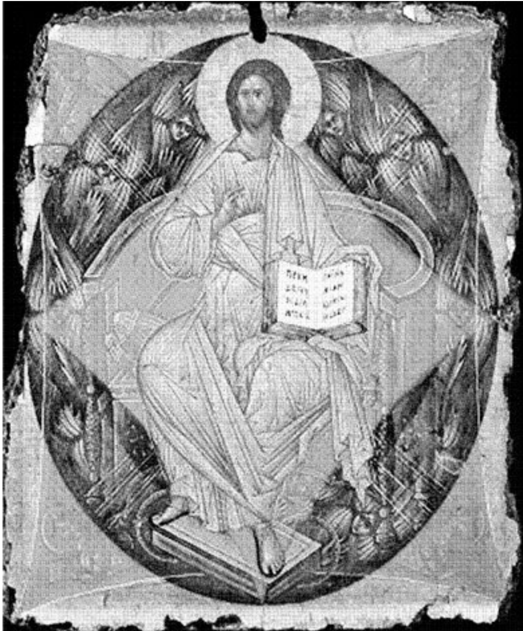
Рис. 4. Икона «Спас в Силах»

БЕЗ ЖИВОТНОГО НАЧАЛА В ЗОЛОТОЕ ЦАРСТВО МУДРОСТИ НЕ ПОПАСТЬ! А чтобы попасть в животное царство, нужно выйти из разделяющего ума и принять жизнь на земле, смириться с ней. Кажется, это легко, но на самом деле очень трудно.