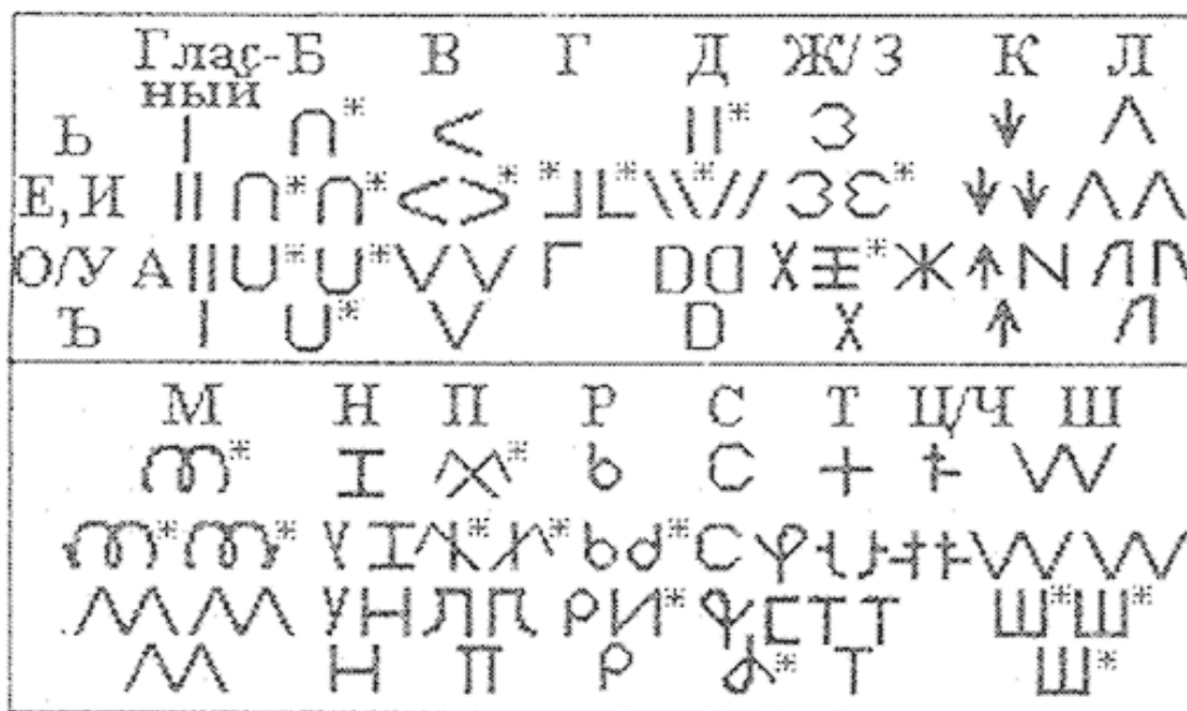
Рис. 2. Древнерусская руница – слоговая азбука

По дороге герой проходит через всякие испытания, а пытается его Баба-яга. Она – старуха – стрх – страх . Есть страх (м. р.) и есть старуха – тот же страх, но женского рода. Поскольку на рунице знак Х соответствует букве Ж в кириллице (см. рис. 2, взято из [41]), тогда привычное нам слово страх означает страж (м. р.), а Баба-яга – старуха , то есть стрха – стража . Видите, чувствуете, как ум медленно поворачивается, чтобы усвоить сказанное (вы же привыкли, что в страже могут быть только мужчины)? Напомню, что в Средние века почти все слова, употребляемые сейчас только в мужском роде, имели свою женскую ипостась (и наоборот), что указывает на то, что наши предки жили в целостном двойственном мире.