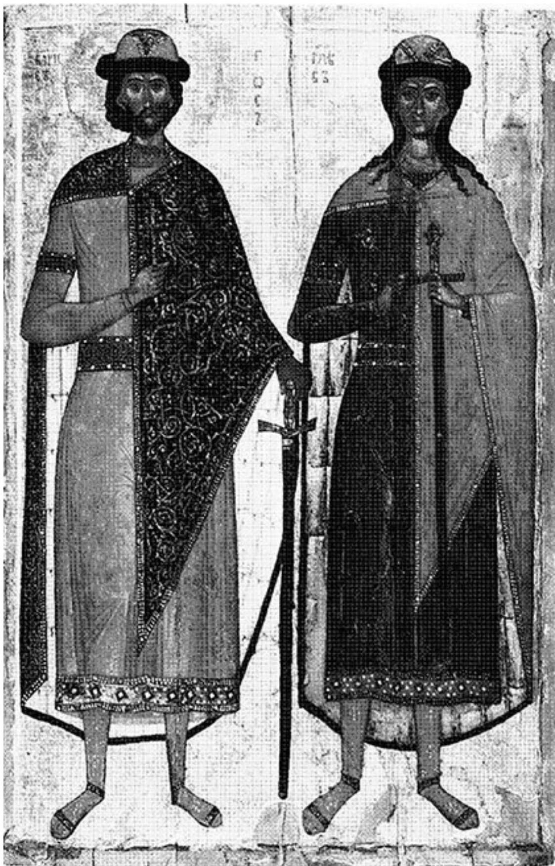
Рис. 3. Святые Борис и Глеб