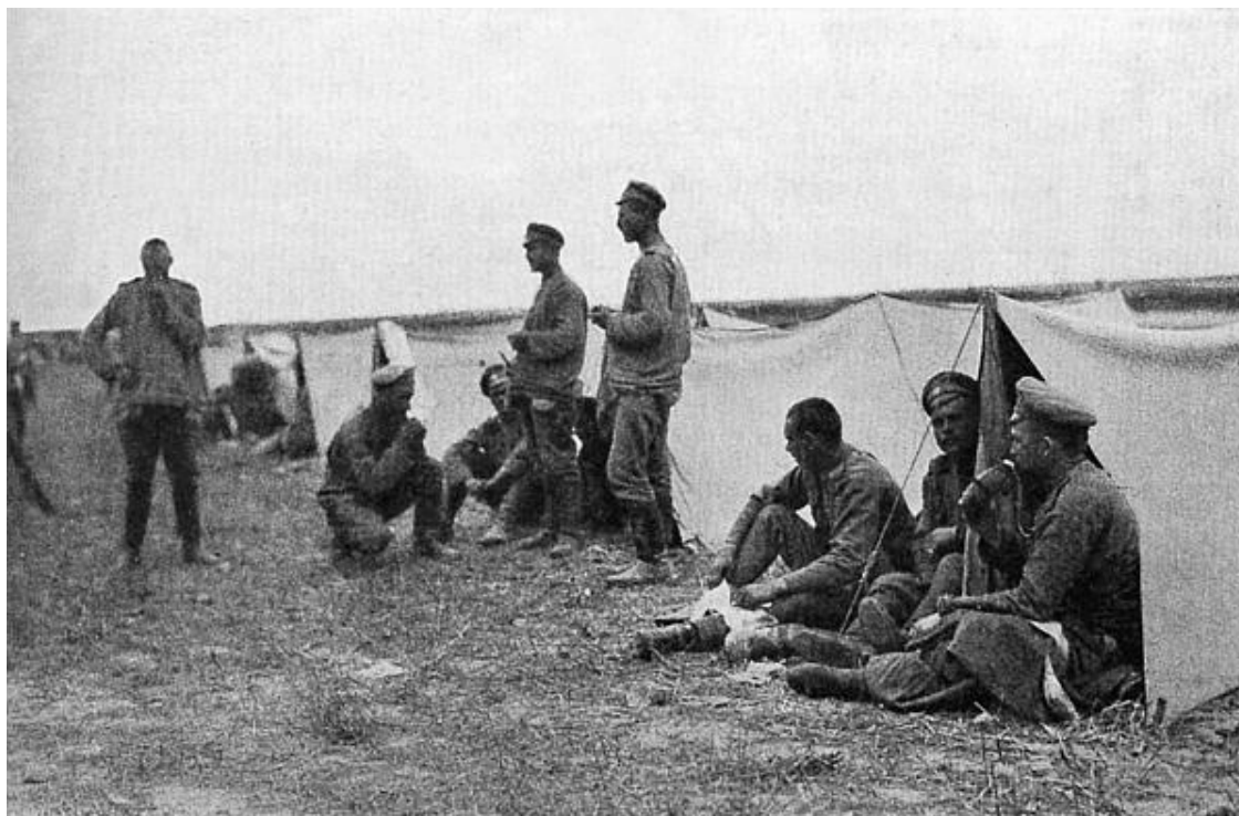
Галиция. У походных палаток

Договор 1892 года подчеркивал самостоятельную роль Российской империи, просто-напросто подстраховавшейся против набиравшей силу Германии, еще ранее образовавшей свой заведомо агрессивный блок. Теперь русские могли играть на франко-германских противоречиях, чтобы иметь независимость и от британского, и от немецкого внешнеполитического курса. Но после Русско-японской войны 1904 – 1905 годов, в которой, кстати говоря, не желавшие ссориться с англичанами ради России французы не оказали русским ни малейшей реальной помощи, положение вещей резко изменилось. Именно тогда стало ясно, что при выборе более принципиального союзника для Франции более дороги будут не русские, а англичане. Впрочем, в России этого, очевидно, в высших эшелонах власти до конца так и не поняли.