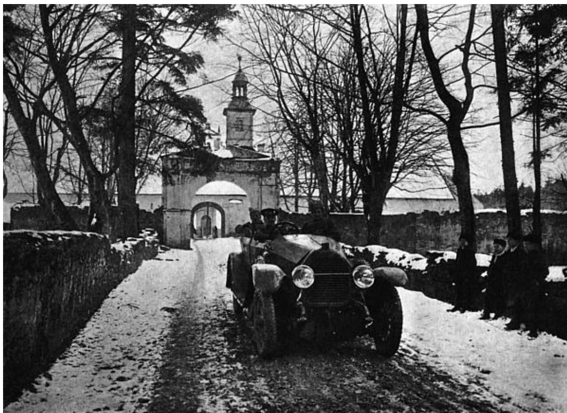
С донесением на передовые позиции

Разумеется, финансирование Западом русской стороны означало, что русские будут обязаны воевать на стороне Франции против Германии, как только к тому представится случай. Недаром в декабре 1913 года французская газета «Корреспондент» указывала: «С момента заключения союза Франция ссудила России свыше семнадцати миллиардов франков, ожидая, что Россия со своей стороны всей своей военной силой поможет Франции. Франция свое обязательство выполнила, России остается сделать то же самое». Такое положение дел позволило А.А. Керсновскому даже заявить, что «уже в 1910 году Российская Империя вполне суверенным государством больше не являлась» 37 .