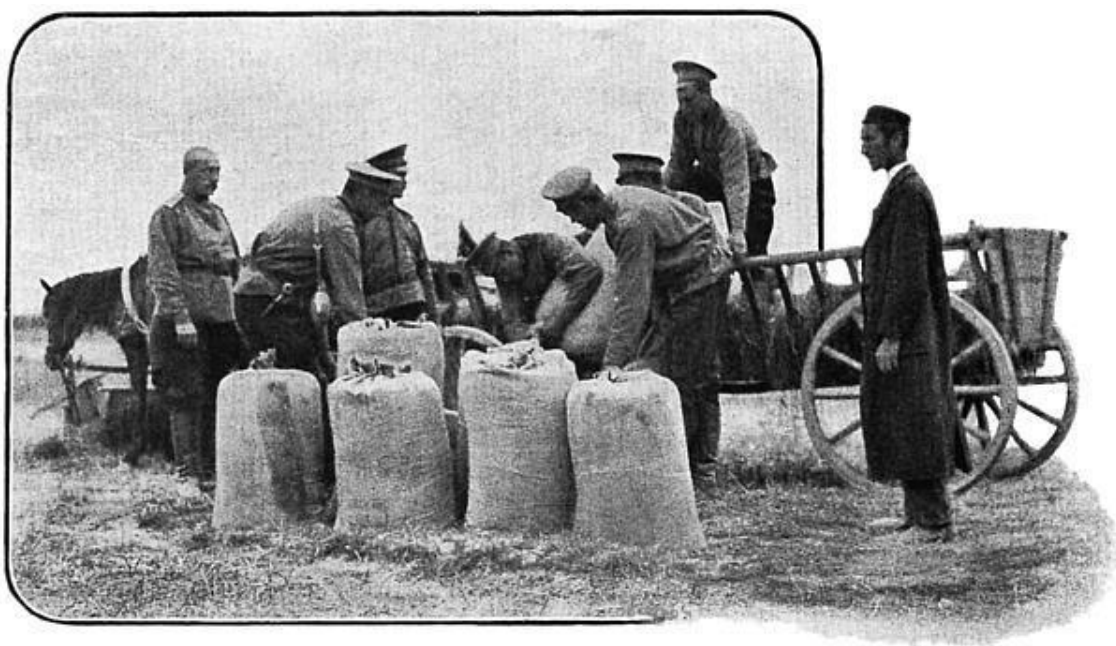
Прием фуража у еврея-поставщика

Такой антигерманский союз наметился между жаждавшими после поражения во Франко-прусской войне 1870 – 1871 годов реванша французами и опасавшимися усиления Германии (как экономического, так и чисто военного) русскими. История тесного сближения Российской империи с Французской республикой берет свое начало в годы правления императора Александра III, вынужденного отказаться от принципа монархической солидарности, так как теперь России противостояла коалиция Германии и Австро-Венгрии, оформленная с участием Италии в 1882 году, – Тройственный союз. Действительно, в австро-германском договоре о союзе, заключенном в 1879 году, 1-я же статья отчетливо указывала будущего противника: «В случае, если бы одна из обеих империй, вопреки ожиданию и искреннему желанию обеих высоких договаривающихся сторон, подверглась нападению со стороны России, то обе высокие договаривающиеся стороны обязаны выступить на помощь друг другу со всею совокупностью военных сил своих империй и соответственно с этим не заключать мира иначе, как только сообща и по обоюдному согласию». Здесь говорится о «нападении со стороны России», однако в 1870 году О. фон Бисмарк превосходно преподавал урок, как агрессивная держава может выставить себя в роли «невинной овечки», – провокация есть превосходная вещь для морального обоснования агрессии.