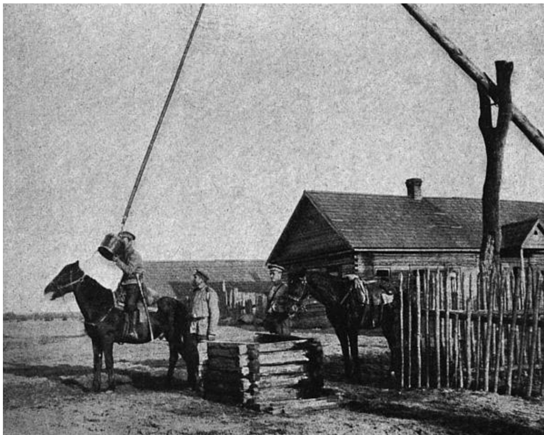
Привал у колодца

Безусловно, германский национализм никоим образом не явился плодом только лишь культурного развития страны (напротив, германская культура и искусство XIX века говорят об обратном), но стал заложником политического и экономического процессов в мировом масштабе. Действительно, бурный подъем немецкой экономики и выдвижение Германии на роль европейского лидера с конца XIX века не могли мирить немцев с тем положением, что Германия занимала на планете. Ведь даже понемногу регрессировавшая Франция, делавшая капитал прежде всего с помощью банков, а не с помощью промышленности, имела куда больше возможностей и вариантов, способствовавших ее экономическому развитию. И все это – благодаря колониям и морской торговле. О Великобритании, державшей в своих руках ключи к мировым торговым путям, и говорить нечего. Терять роль «морского перевозчика» и «мастерской мира» англичане не собирались. И потому немцы сделали главную ошибку – ставку на грубый национализм, что в конечном счете оттолкнуло от них весь континент, ибо вызов был брошен всем одновременно.