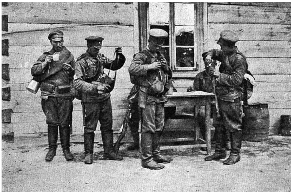
Галиция. Солдаты запасаются водой в баклажки

Уже только один этот факт позволяет сделать вывод, что история новейшего времени последовательно и упорно выбивала «из строя» европейские монархические режимы, с тем чтобы к середине столетия не оставить ни одной авторитарной монархии в Европе и среди великих держав. Все это явилось логическим следствием развития такого явления в экономической жизни планеты, как индустриальный капитализм. В политической же сфере начало падения монархичности как явления жизни Европы, как явления скорее духовного, нежели материального порядка, положила Первая мировая война 1914 – 1918 годов.