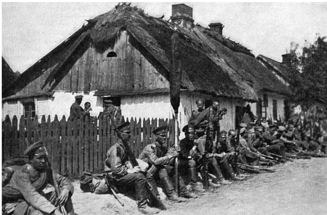
Галиция. На привале

А между тем это соглашение в самом деле создавало единую Европу, но... под верховенством Германии. Император Николай II, отлично сознававший потенциал Российской империи, возможно, и был согласен на временное подчинение немецкому капиталу, однако все государственные и общественные деятели России предпочли подчинение капиталу французскому, что практически, на деле, вело к вооруженному столкновению с Германией. Договор в Бьерке по своей сути, как и конвенция 1892 года, носил оборонительный характер. Он создавал возможность для установления сравнительно прочного мира на континенте (в ближайшей перспективе), почему и был объективно направлен против Великобритании, заинтересованной в континентальной войне, чтобы подорвать позиции своего конкурента – Германии (ослабление Франции и России – также неплохо).