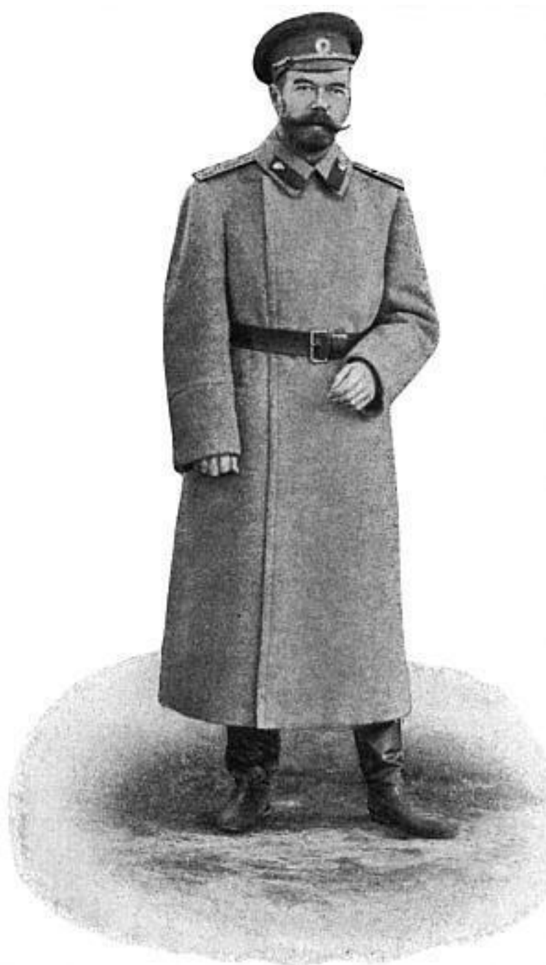
Император Николай II в походной форме

Интересы России не пересекались с чьими-либо еще до такой степени, чтобы рисковать своим участием в мировой войне. Можно, конечно, возразить, что остаться в стороне было чрезвычайно тяжело. Это так, но для чего же тогда существует дипломатия? Ведь при императоре Александре III союз с Францией уже существовал, но никакой жесткой зависимости в области внешней политики и близко не было. Ведущие русские политические деятели отлично сознавали, что доминирующим фактором международных отношений являлось англо-германское соперничество, которое не могло не затронуть Россию.