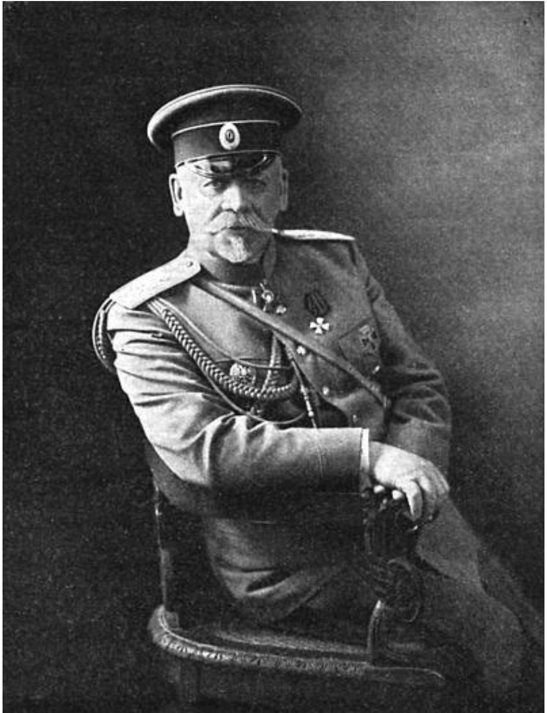
Военный министр генерал-адъютант В.А. Сухомлино

Именно поэтому уже в эмиграции ген. В.А. Сухомлинов имел все основания отметить: «Прежде всего, вопрос – готовы ли мы были к войне? В 1909 году, не только безусловно не готовы были, но наша армия находилась в полнейшем развале. В 1914 году же в ней порядок и боеспособность оказались восстановленными настолько, что к выступлению в поход продолжительностью от четырех до шести месяцев, никаких сомнений не возникало» 41 . Генерал Сухомлинов абсолютно прав. Накопленные запасы артиллерийских боеприпасов закончились ровно на пятый месяц войны (первые требования Ставки о радикальной экономии снарядов