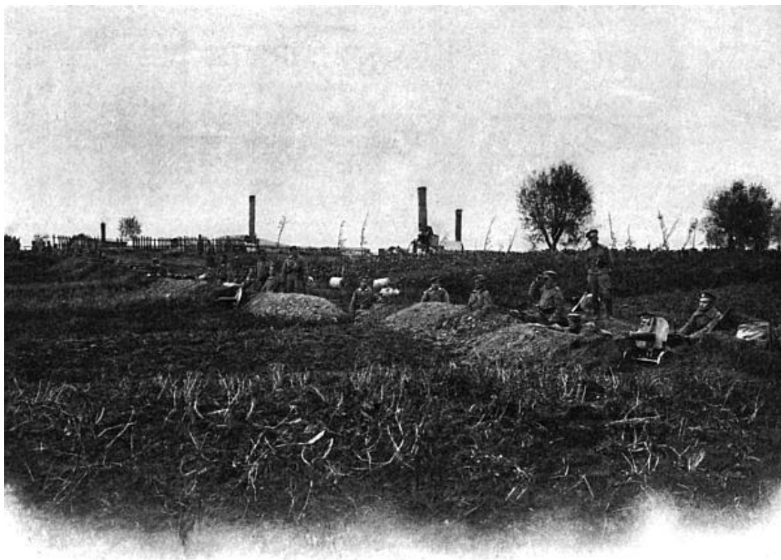
Пулеметная команда на позиции

Германский канцлер справедливо полагал, что образование Тройственного союза было вызвано намерением русской стороны сделать Германию зависимой от России. Экономическое развитие Германской империи настолько превосходило русское, что политическое давление России на немецкие земли было нестерпимым, и в этом отношении претензии Германии на континентальную гегемонию посредством освобождения от русской политики являются вполне обоснованными. Другое дело, что Германия вскоре поспешила перейти от экономической гегемонии к планам военно-политического диктата, опираясь на свой союз с Австро-Венгрией 1879 года. А это уже не могло устроить ни Россию, ни Францию.