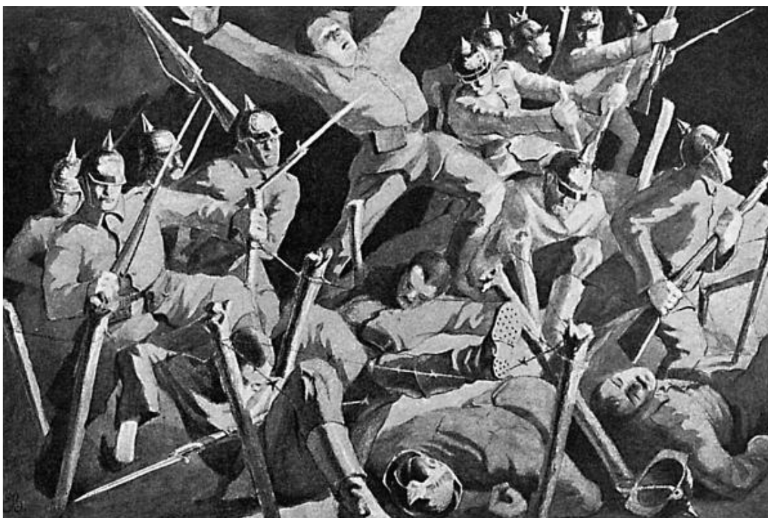
Атака немцев в лучах русского прожектора

Но могло ли быть иначе? Бурно набиравшая темпы германская промышленность требовала рынков сбыта, а это, в свою очередь, требовало торгового флота и стратегических железнодорожных магистралей, пересекавших континенты Старого Света. Молодая и агрессивная немецкая экономика – против старого и опытного британского морского и промышленного могущества. Все прочие страны, за исключением обладавших громадным потенциалом России и Соединенных Штатов Америки, должны были послужить статистами в этой борьбе. Однако если США сумели воспользоваться выгодами своего географического положения, отсидевшись за Атлантикой, и воспользоваться плодами европейской бойни сполна, то Российская империя пошла на поводу у Великобритании и проиграла все, что имела в своих активах.