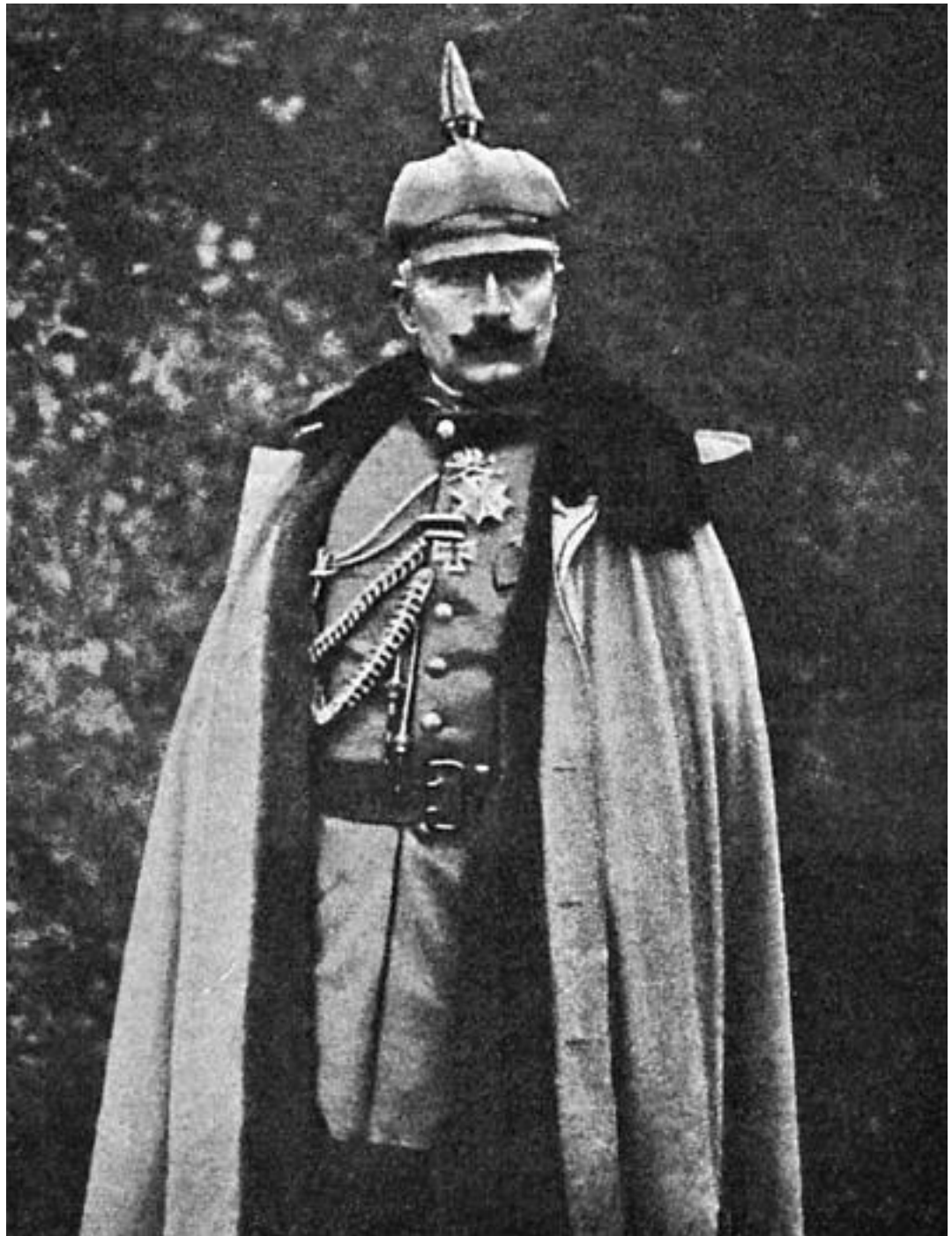
Император Вильгельм II

Возможно, справедлив тот вывод, что мировые войны так или иначе подразумевали установление чьей-либо гегемонии в Старом Свете и сверхдержавный статус победителя в Европе. При определенных условиях эта гегемония могла стать всемирной. И какова была бы роль России в случае несостоявшейся революции 1917 года, еще большой вопрос: политика союзников в отношении Российской империи отчетливо подчеркивала их нежелание грядущего усиления русской мощи.