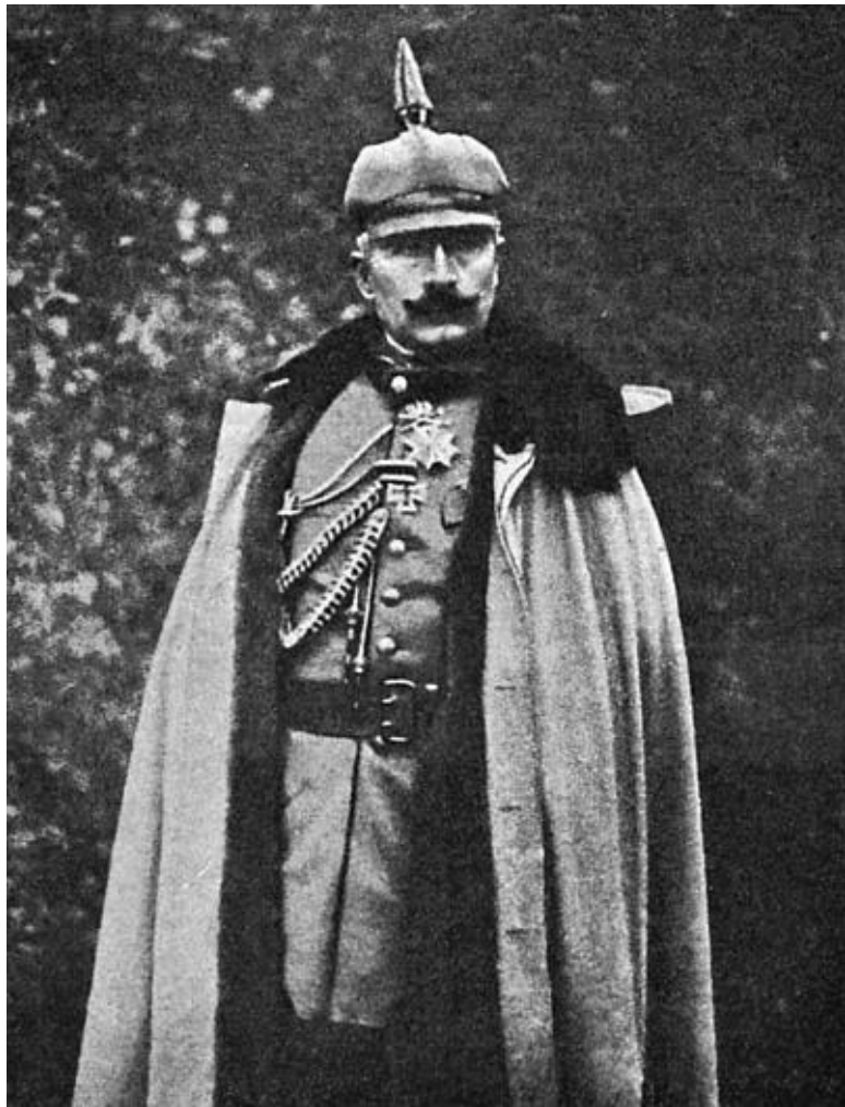
Император Вильгельм II