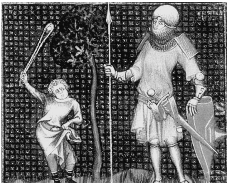
Давид против Голиафа. С картины XIII в.

с Голиафом (Голиатом), могучим филистимским силачом. Впоследствии как воин на службе у царя, а затем как командир особого отряда Давид не раз смотрел смерти в лицо. Когда он в возрасте сорока лет стал царем, ему предстояло пройти еще большой путь: одержать впечатляющие победы на севере и на юге, на востоке и на западе и расширить границы страны так, как никто не смог до него. Давид правил четыре десятилетия.