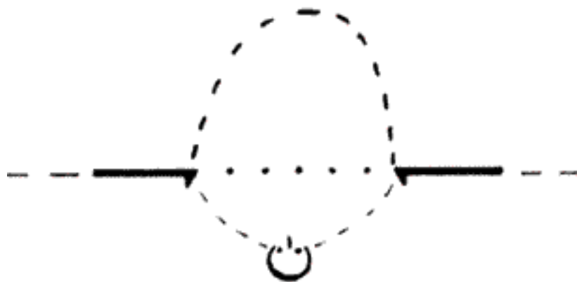
Рис. 4. Пространство картины и пространство зрителя. Джотто воспроизвел на плоскости глубокое трехмерное пространство

На фресках на плоскости стены, т. е. на двухмерном пространстве , Джотто сумел убедительно показать трехмерное пространство мира, в котором протекает земная жизнь. Таким образом, пространство картины стало глубоким, трехмерным пространством (рис. 4). Особое значение в этом смысле имеет фреска «Благовещение святой Анне» (рис. 5).