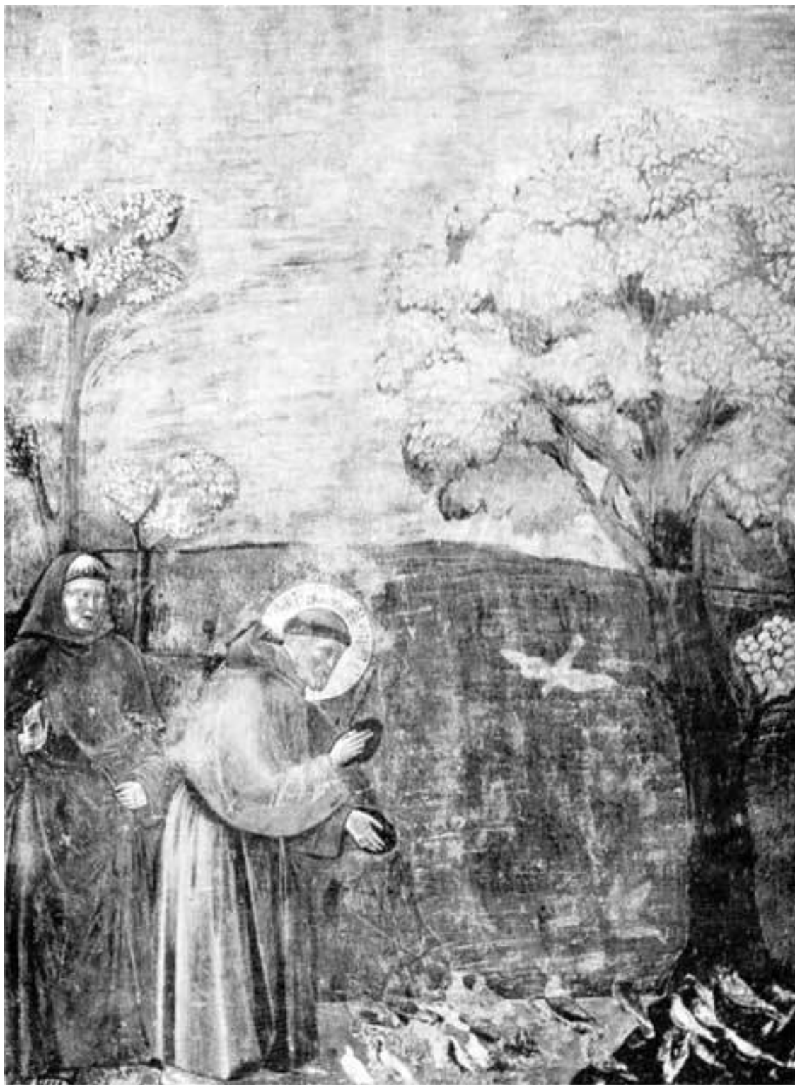
Рис. 2. Фреска Джотто «Святой Франциск проповедует птицам». Ассизи, церковь Сан Франческо, ок. 1295–1230 гг.

Святой Франциск виден нам сбоку. Он склонился, а его лицо и взгляд обращены к птицам, которые находятся перед ним на земле. Это живой человек , внимание которого сосредоточено не на зрителе, а на предмете его сегодняшней заботы – птицах. Примечательно, что Джотто удалось показать, как внимательно птицы слушают Франциска. Поза святого Франциска естественна, его руки в движении – он жестикулирует, убеждая слушающих его птиц. Такое изображение святого было очень смелым и новаторским.