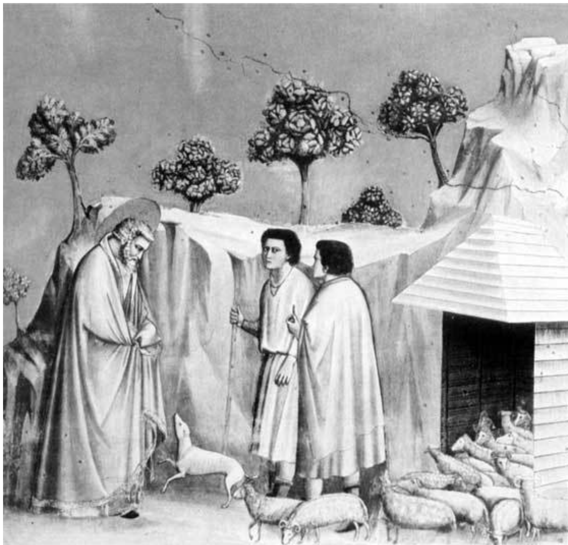
Рис. 3. Фреска Джотто «Возвращение Иоакима к пастухам». Падуя, капелла дель Арена, 1303–1305 гг.

Еще более сильное впечатление в этом отношении производит фреска «Возвращение Иоакима к пастухам» (рис. 3). Сюжет фрески основан на одном из преданий, которые изложены в «Золотой легенде», составленной Иаковом Ворагинским примерно в 1260 г. и чрезвычайно популярной в Европе. Многие рассказы «Золотой легенды» почерпнуты из апокрифических евангелий (см., например, [1, с. 117]).