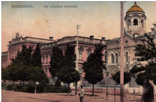
Кишинёв: мужская гимназия