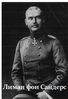
Лиман фон Сандерс