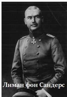
Лиман фон Сандерс

Зачем было турецкому маршалу (с 16 января 1914 года) и немецкому генералу Отто Липманну «зачищать» границы в невоенное и даже не в предвоенное время? Может быть, ему было известно о предстоящем 28 июня 1914 года убийстве эрцгерцога Фердинанда и о предстоящем 28 июля 1914 года начале Первой Мировой войны и он готовился к ней?