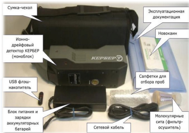
Рисунок 1. Комплект поставки ИДД «Кербер»

В комплект поставки ИДД «КЕРБЕР» входят изделия и документы, представленные на рисунке 1.