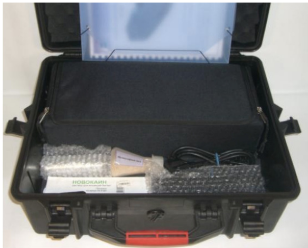
Рисунок 2. Схема укладки

Схема укладки ИДД «Кербер» в транспортную тару представлена на рис. 2.