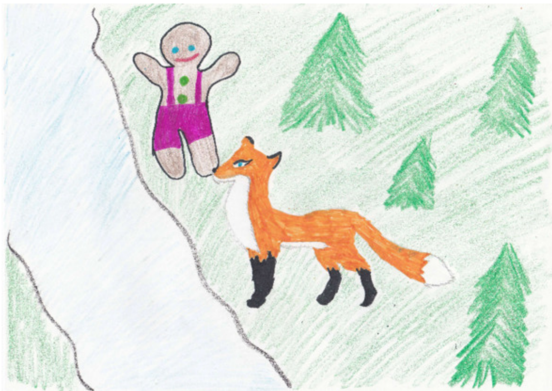
джиджер и хитрый лис

Жаль, что у сказки такой грустный конец! Мне бы хотелось, чтобы наш смельчак всех перехитрил, остался жив и пережил много интересных, забавных и поучительных приключений.