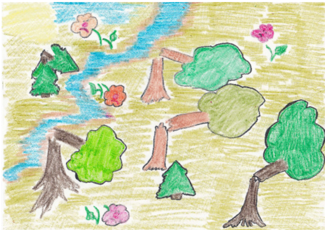
бурелом в сказочном лесу

И я побежал вперед – что было сил. Мои ноги стали утопать во влажной земле, видимо, дождик здесь идет круглый год – так это я себе объяснил. Черные человечки окружали меня, немного покачиваясь и поскрипывая от налетевшего ветра... На моих ногах уже остался только один кроссовок, но не успел я пожалеть об этом, как споткнулся и полетел кувырком под откос – прямо до берега какой-то речушки.