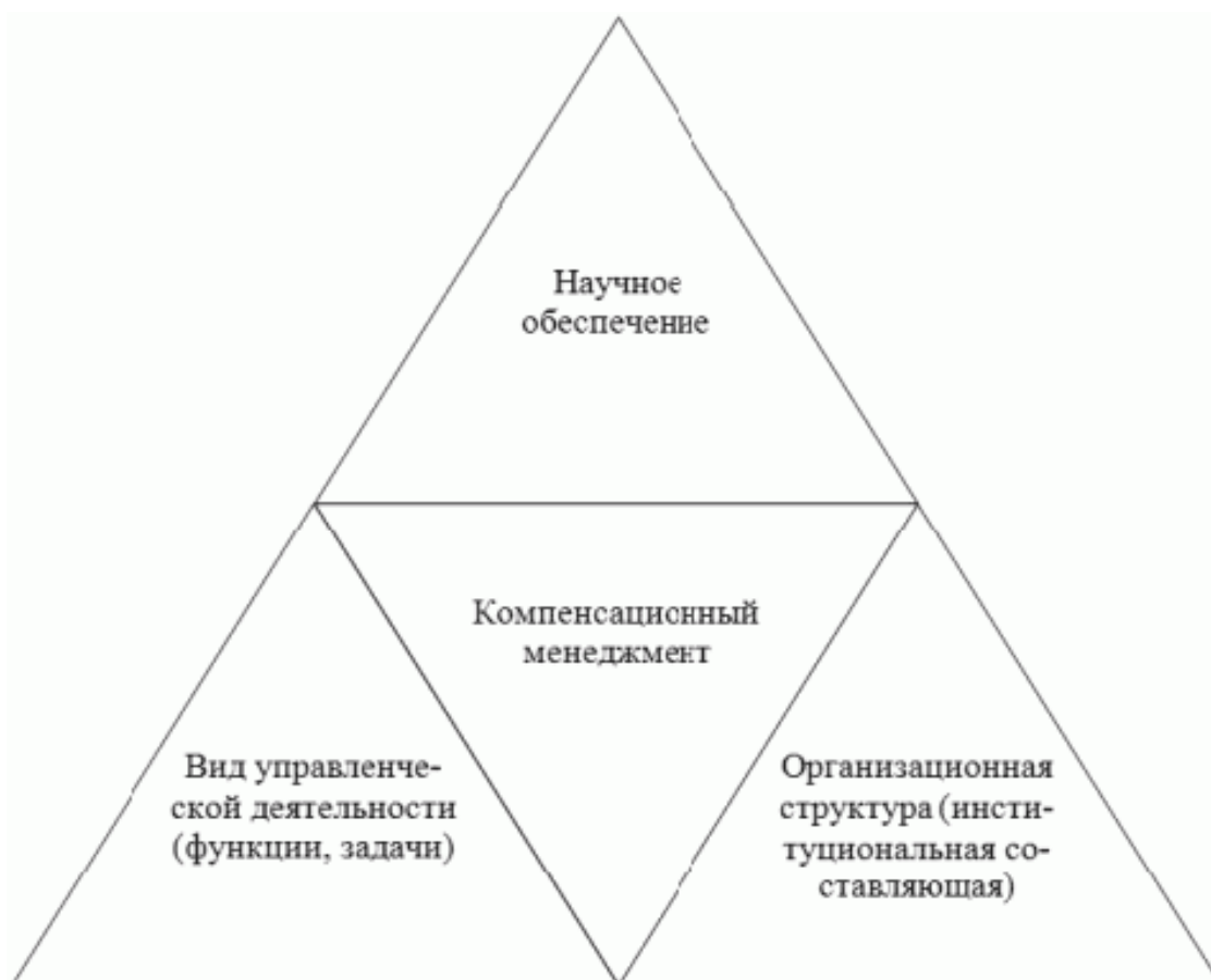
Рис. 1. Схема взаимосвязи структурных частей дисциплины «Компенсационный менеджмент»

Дисциплина «Компенсационный менеджмент» как наука представляет собой совокупность теорий, концепций, принципов, стратегий в сфере вознаграждения наемных работников, а также общенаучного и специального предмета управления человеческими ресурсами, экономики и организации труда, трудовой мотивации, социально-трудовых и правовых отношений и пр.