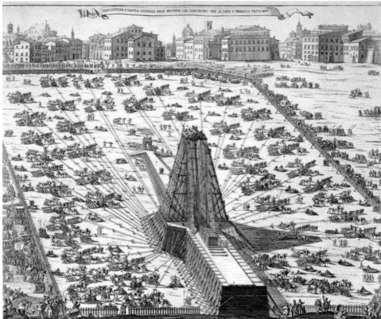
Рис. 5. Установка обелиска Нерона перед собором Св. Петра. По рисунку Доменико Фонтана. XVI в.

Император Нерон в своих гонениях на христиан и в досаде на апостола Петра за обращение в христианство двух любимых жён, приказал заключить его в темницу и потом казнить. Незадолго до этого по просьбе верующих Пётр пошёл было ночью вон из Рима, чтобы спастись; но в то время, как он выходил из города, ему в видении явился Господь, входящий в Рим. «Господи, куда Ты идёшь?» – спросил Его