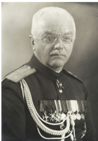
Генерал-майор, барон Алексей Павлович фон Будберг.

– Алексей Будберг воевал на стороне Белой гвардии. Военный министр Колчака. В 1920 году – командующий Владивостокской крепостью. В 1921 году эмигрировал в Манчжурию, потом во Францию и в США. С 1924 года – Руководитель Общества Русских Ветеранов Великой войны. Умер в Сан-Франциско.