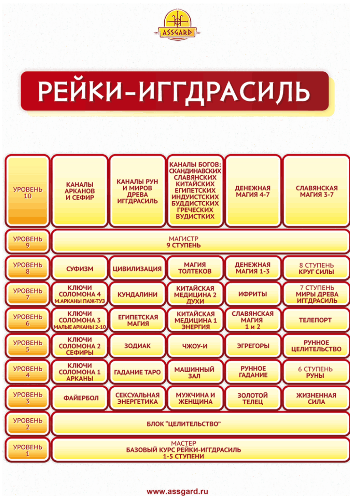
Рис. 2. Структура системы Рейки-Иггдрасиль