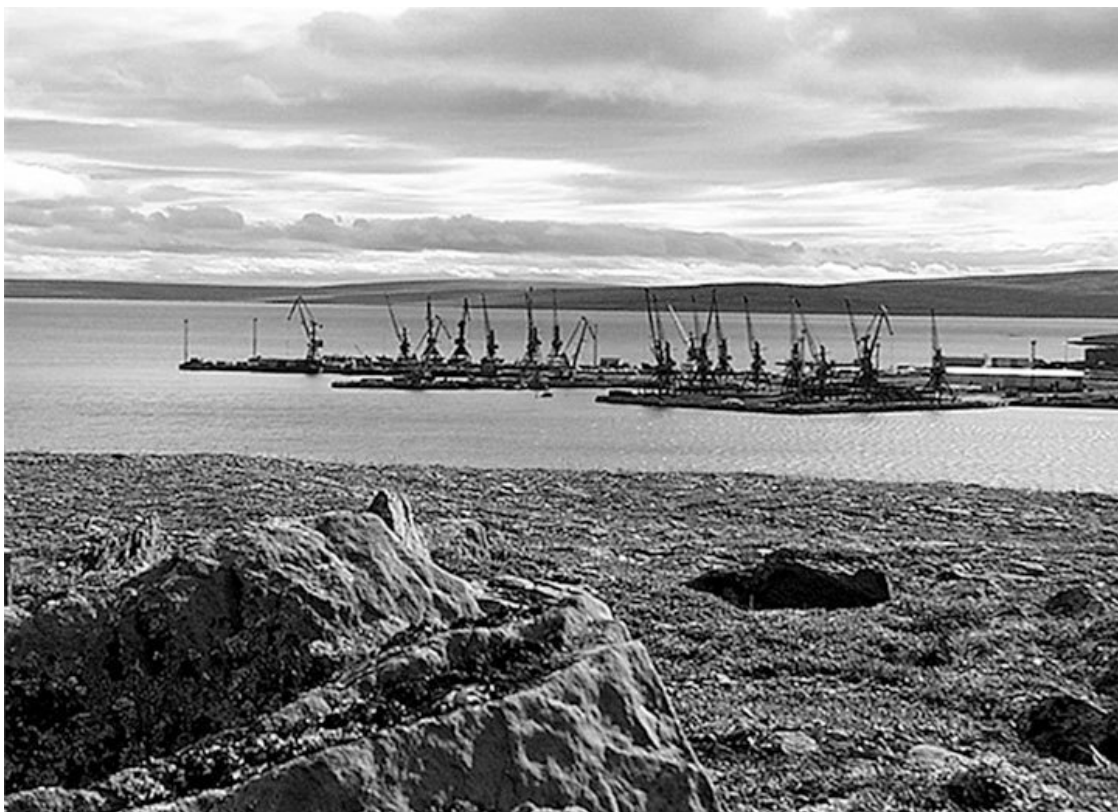
Порт Тикси. Морской участок

Среднегодовая температура – плюс пять... Свинцовые облака чешут «брюхо» о вершины сопок. На главной высоте выложено железными бочками – «Слава СССР».