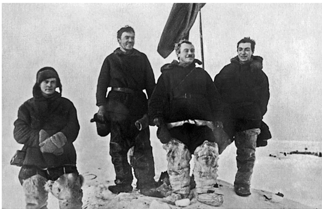
Дрейфующая станция «Северный полюс-1». Папанинцы

Все знаменитые полёты в Арктику, на Северный полюс совершались через Архангельск. Здесь побывали папанинцы, Шмидт, полярные летчики-асы Бабушкин, Водопьянов, Молоков, Чухновский и другие. Воротами в Арктику, городом полярных экспедиций Архангельск остаётся и в наши дни. Не зря принято решение о том, что Администрация Северного морского пути будет располагаться в двух офисах: в Москве и Архангельске. Сотрудники поморского офиса занимаются «прикладными» проблемами: улаживают вопросы, касающиеся использования полярной авиации, согласовывают работы с Росгидрометом.