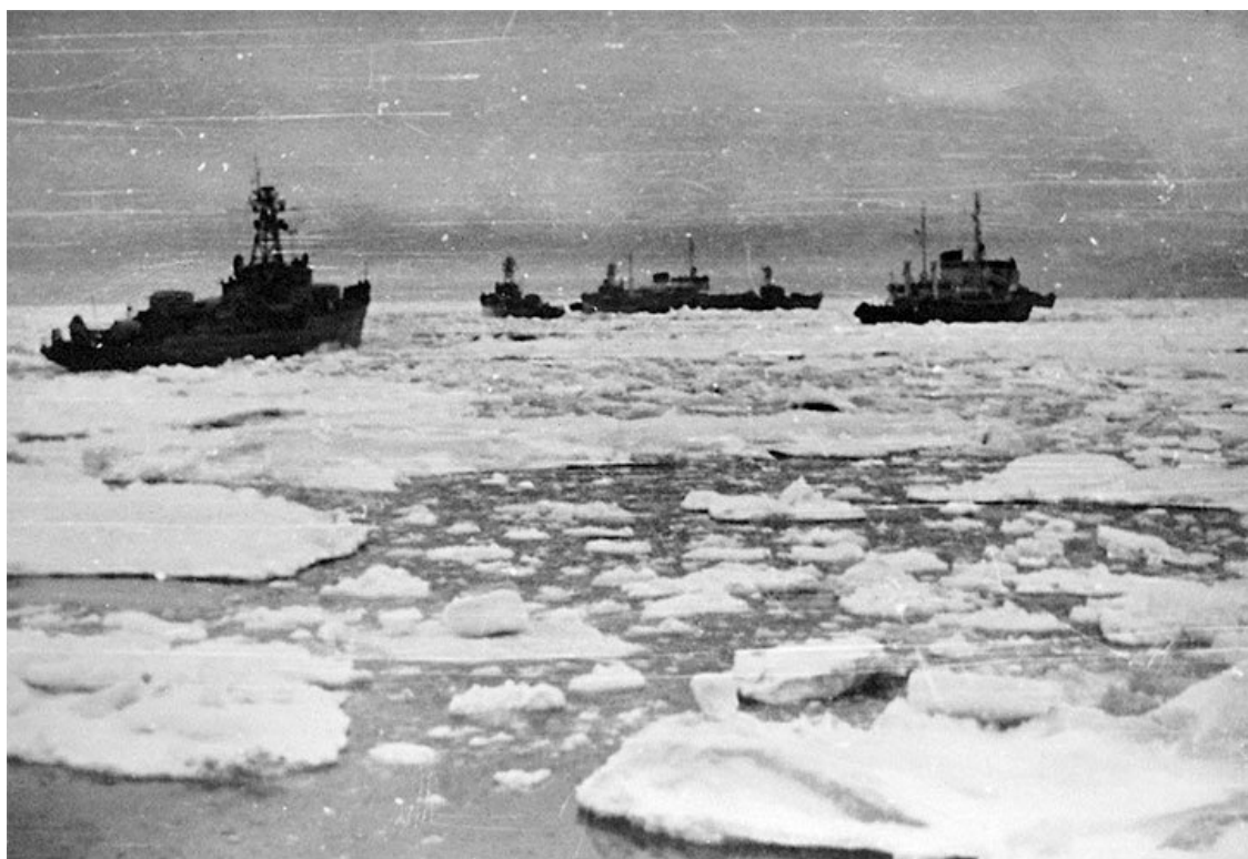
Караваны судов проходят пролив Вилькицкого