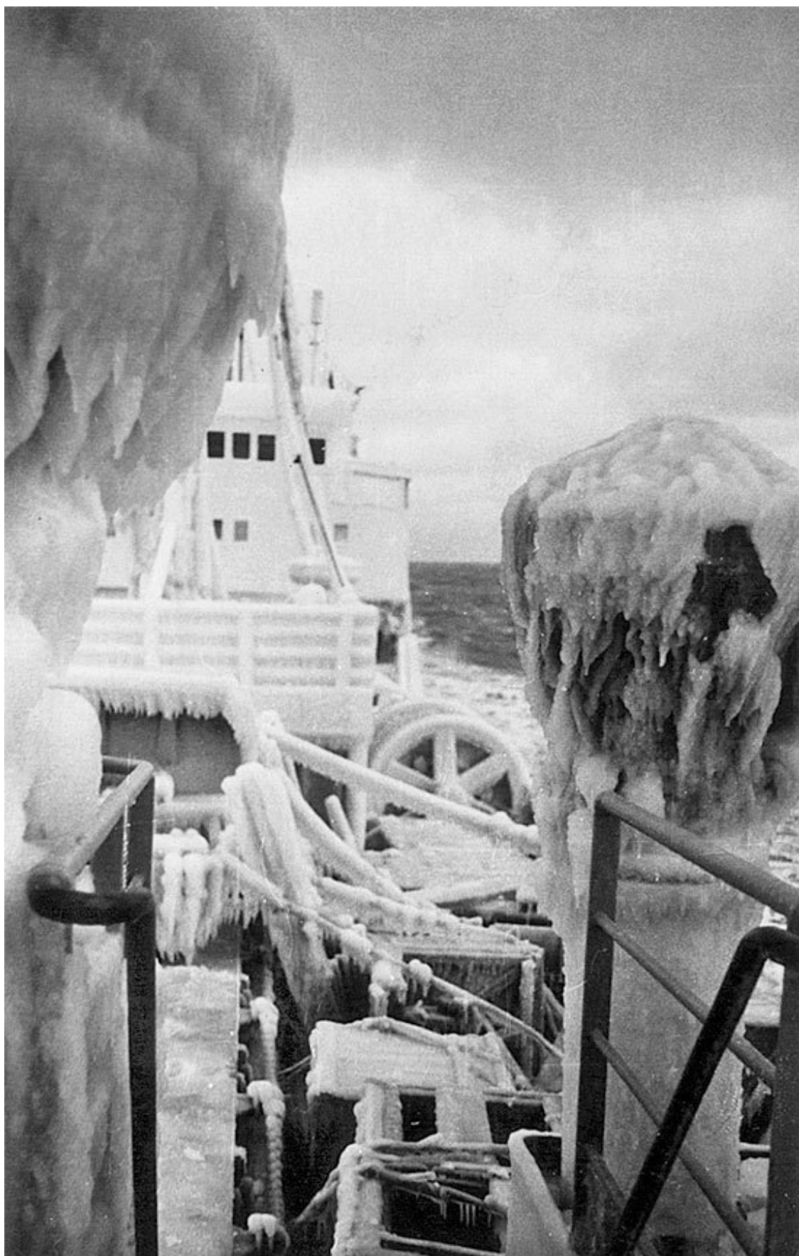
Теплоход «Абагурлес» после арктического рейса