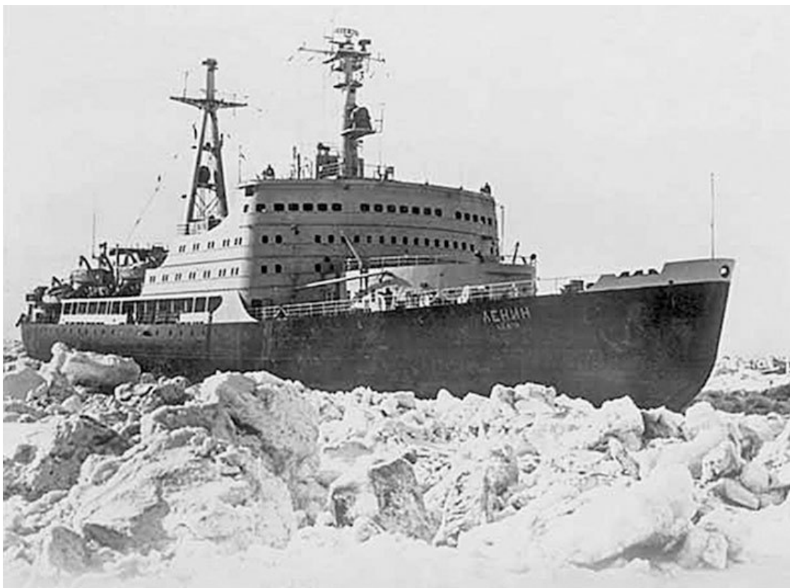
Атомный ледокол «Ленин» во льдах Арктики

Следует коротко рассказать о Диксоне. Этот посёлок расположен на одноимённом скалистом острове на берегу Енисейского залива Карского моря. Морской порт. Район Диксона – арктическая пустыня с суровым климатом.