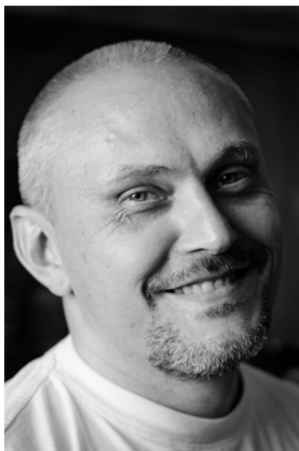
Святослав Дубянский, автор