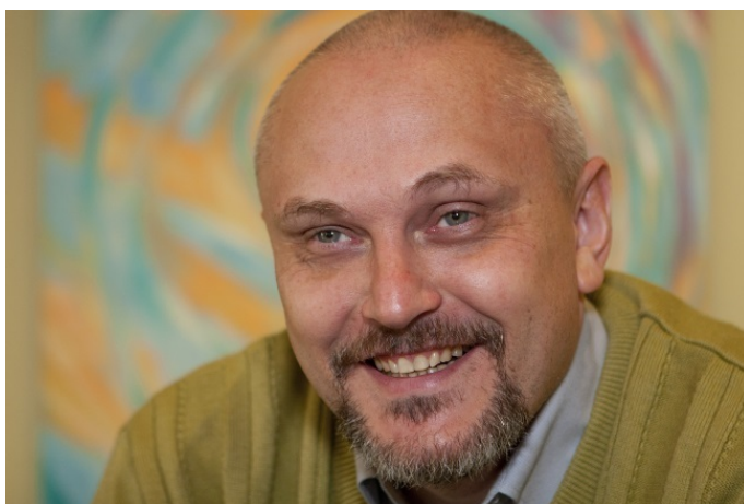
Святослав Дубянский, автор