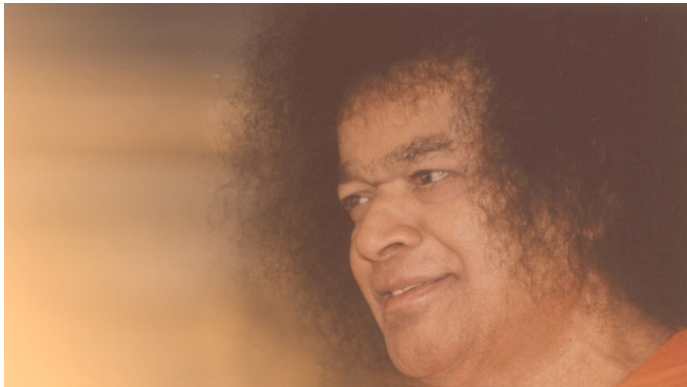
Сатъя Саи Баба