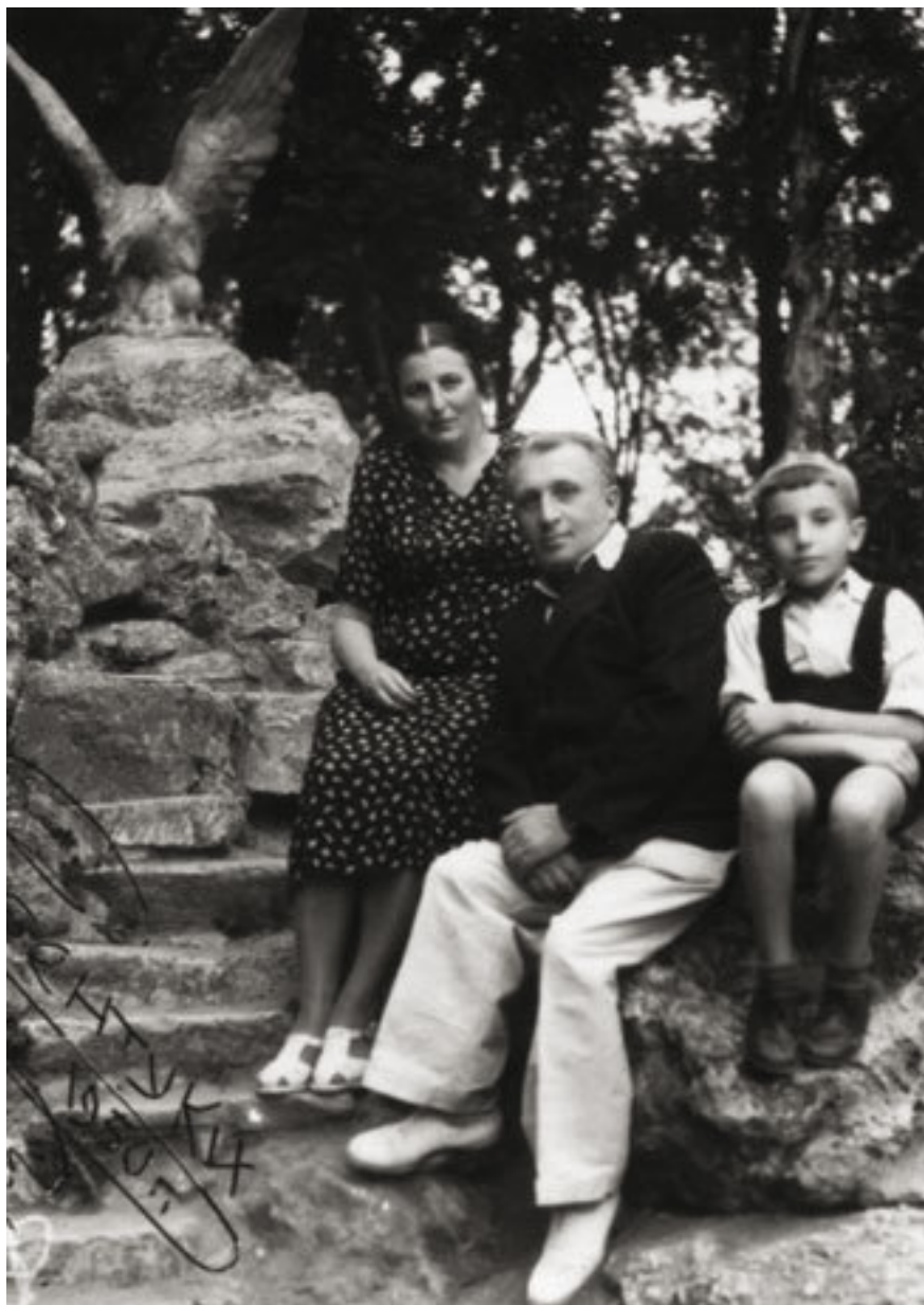
Кисловодск, 1950 г., мне 8 лет