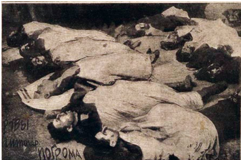
Жертвы второго петлюровского погрома в Житомире

Фото 1919-го года из книги З. Островского «Еврейские погромы 1921-1918 гг.» (М., 1926 г.)