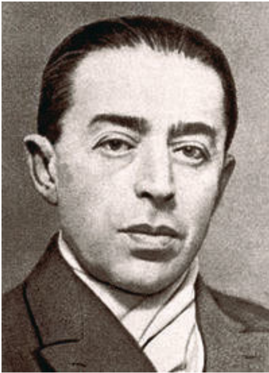
Зяма (Зигмунд) Розенблюм – он же Сидней Рейли, супершпион