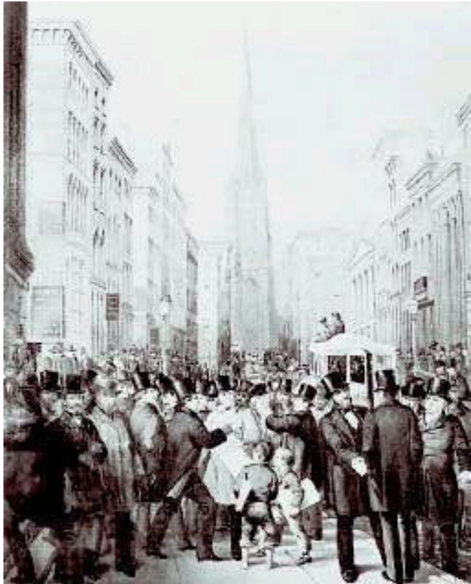
Финансовая паника на Уолл-стрит в 1857 году.

– Те, кто вовремя это понял, поспешили от акций избавиться. Остальным было плохо.