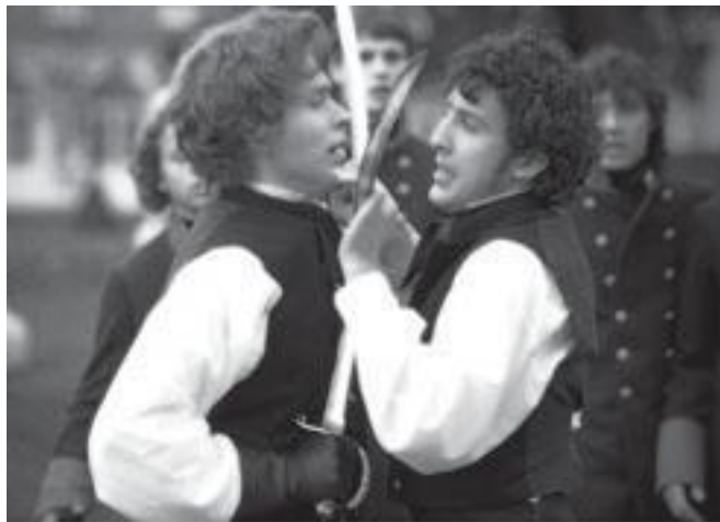
Дельвиг и Кюхельбеккер спорят о поэзии (снято папараши)

Страшно сказать, как поступила бы с ними советская власть, живи они в тридцатые годы. Тут уже все параметры, как один, вписывались в расстрельные статьи. Так что лучше и не представлять, что с ними тогда бы было.