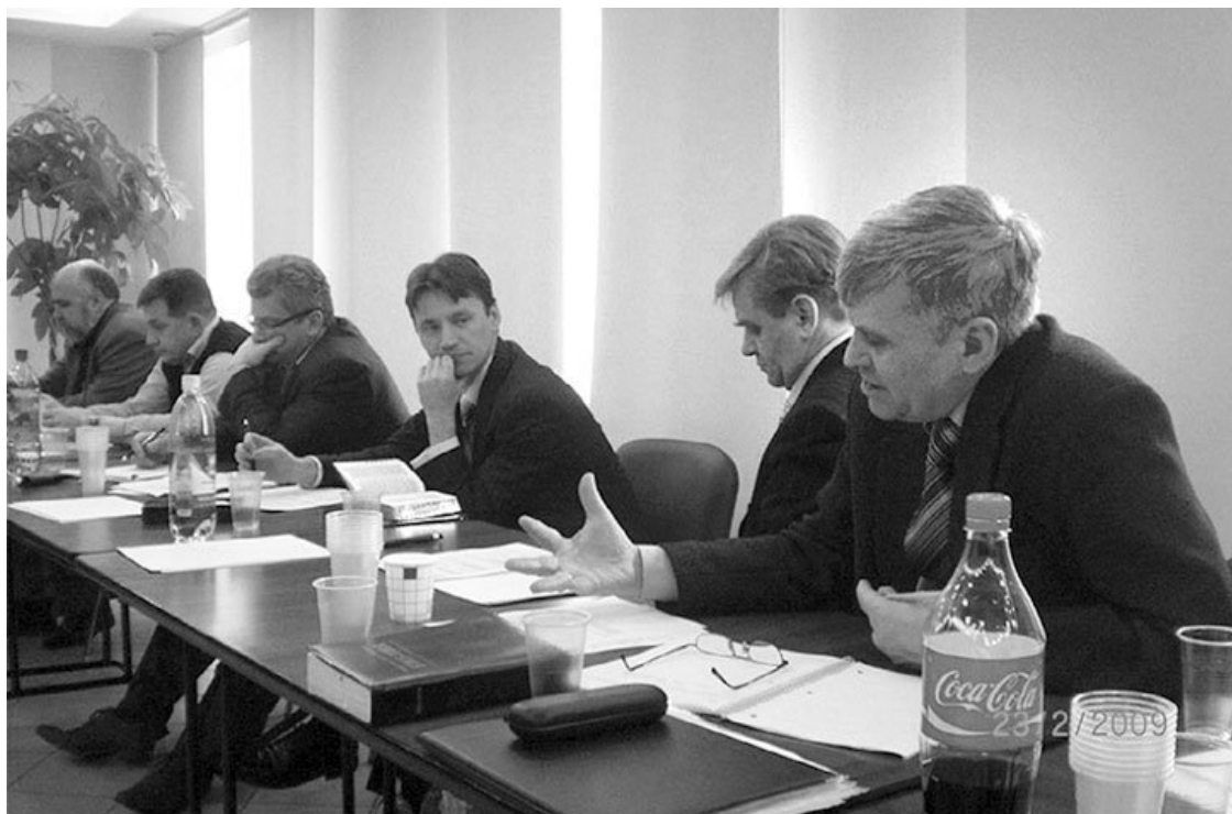
На заседании Общественного совета

Не будут знать и писать о нас светские СМИ, если то, что мы делаем и чем живём, не представляет для нас самих такой ценности, не доставляет такого восторга, не сообщает такой непреходящей радости, что мы везде только об этом и говорим!