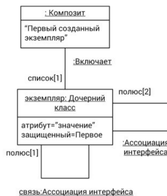
Рис. 2. Нотация диаграмм экземпляров