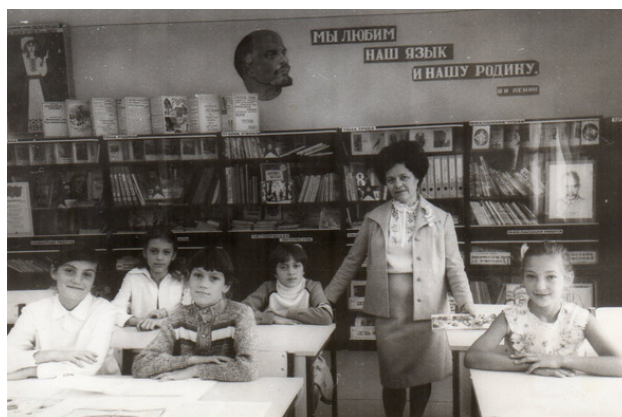
Ziua usilor descise, scoala №25. Chisinau. 1981

Deși cărunt, ai rămas același bărbat frumos. Vorbeai foarte frumos și era o mare plăcere să te ascult, dar totul s-a stins.