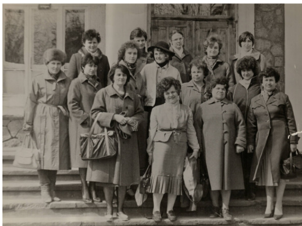
Sectia de limba rusa, scoala din Ghidighici. 1986