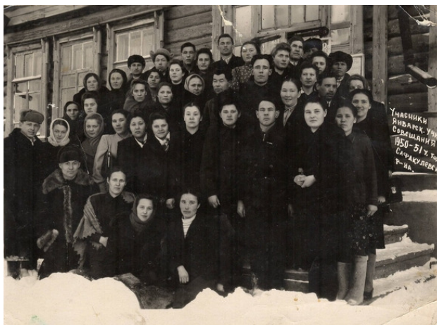
Conferența pedagogilor. Safaculevo. Siberia. 1950