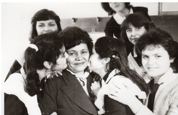
Clasa №8. Chisinau. 1980