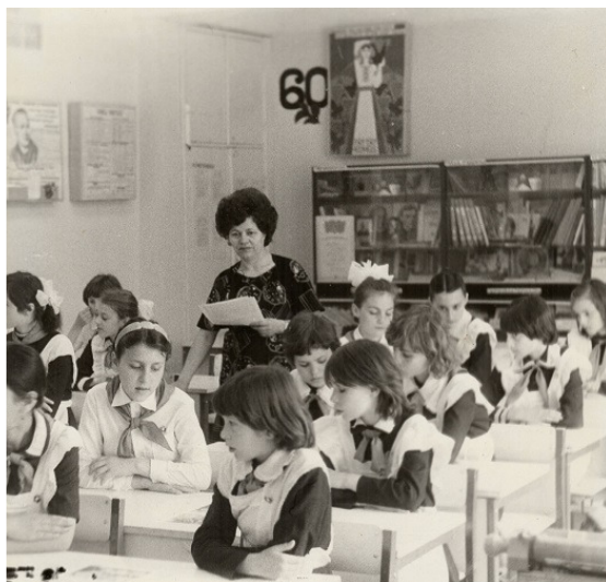
Cabinetul exemplar de limba rusa, scoala №25, Chisinau, 1982

Cu drag păstrez doar amintiri plăcute despre primii ani de școală. Eram ținută toată ziua în băncile incomode care ne deformau coloana vertebrală și erau vopsite urât cu vopsea neagră. De fiecare dată întâlneam blînda și draga noastră învățătoare. Eram foarte nerăbdătoare, inima îmi bătea cu putere, dar, în același timp, eram foarte fericită cu ivirea ei în clasă. Arăta ca o zîna cu chip de înger, cu glas duios, cu ochii albaștri ca seninul cerului și cu părul auriu ca spicele grîului. Noi, micuții, eram ca puii de rîndunică răspîndiți pe cer, dar ea cu blîndețea și dragălașia ei ne-a adunat într-un colectiv și ea ne-a condus primii pași spre lumină, cu mîna ei plîpîndă ne conducea condeiul din mîna noastră tremurîndă. Primii ani de școală sînt o perioadă a descoperirilor. Copiii au sete de a cunoaște, de a înțelege și învățătorul îi înzestrează cu mijloace de a învăța, de a dezvolta tot ce e dat de Dumnezeu. Da, primul dascăl e dator să dobîndească buna cunoaștere a capacității și intereselor fiecărui elev. Acum citesc autobiografia scriitoarei engleze, Agatha Christie, și mă mir cît de fericită i-a fost copilăria și cîte lipsuri am avut eu în copilărie.