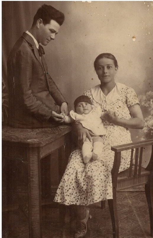
Parintii mei. Cascalia. 1932

Cu cuvintele lui Grigore Vieru aș zice: “Ador meleagul meu natal, iubesc eu casa părintească, Și-n fiecare zi, mă uit mereu pe geam, Și parc-o văd pe mama la fereastră.”