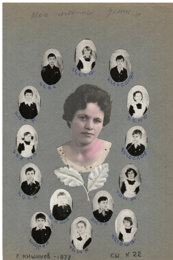
Scoala primara № 22. Chisinau. 1980

Au trecut anii și eu de acum am încărunțit și pe unde numai nu i-a necăjit și pe ei soarta. Au fost vremuri grele, război, sărăcie, foamete, ocupație ba de ruși, de români, de turci, Siberia, de care se temeau toți pe atunci. Cică secretul soartei rămîne veșnica ghicitoare pentru toți și fiecare din veac în veac, din an în an, din zi în zi, din oră în oră. Bătrînețea este o lege a firii. Tatăl meu a viețuit 96 ani, o vîrstă foarte înaintată. Se zice că viața care durează mai mult este un semn de civilizație, este un dar de la Dumnezeu și o cucerire, o ocazie extraordinară pentru o conviețuire mai umană și valoarea omului se măsoară după greutățile prin care a trecut. Dificultățile îți întăresc mintea așa cum munca fizică îți întărește corpul.