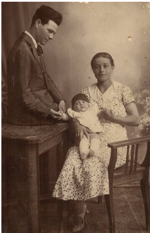
Parintii mei. Cascalia. 1932

Toate acestea îmi împlinesc sufletul, amintindu-mi copilăria. Copilăria mea n-a fost așa de fericită ca a copiilor de astăzi, dar fericită într-un fel anume în sufletul meu copilăresc de odinioară. Dar timpul nemilos se duce și nu poți întoarce nimic înapoi,