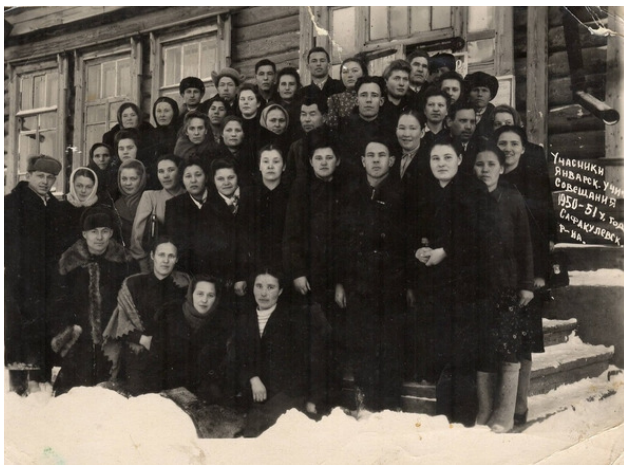
Conferenta pedagogilor. Safaculevo. Siberia. 1950