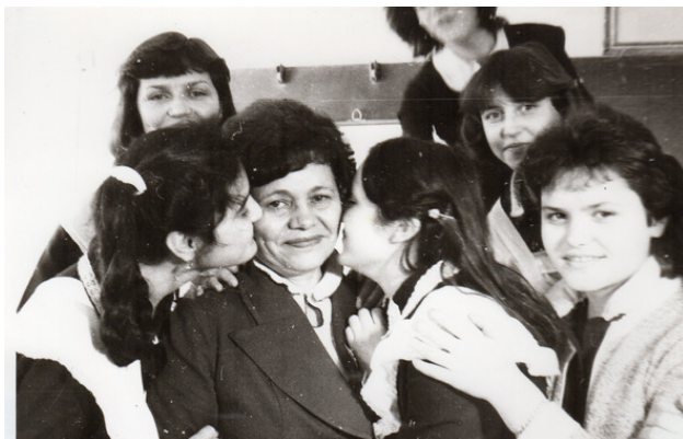
Clasa №8. Chisinau. 1980

aranjat pe mine, fiindcă eu țineam mult la ea. În afară de lecții, ea ne învăța jocuri și dansuri, juca mingea cu noi în ograda școlii. Pe atunci nu erau ca acum aparate de fotografiat, s-a păstrat numai o singură fotografie, pe imagine eu cu o grupă de dansatori, eram îmbrăcați în uniformă. Mi-a împletit mama un brâu național cu trei culori ca steagul românesc, coftița era brodată de mama în stil național. Acest costum s-a păstrat mulți ani.