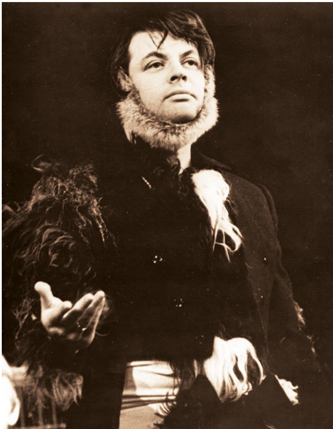
В спектакле «Клеменс» по литовской пьесе в переводе Григория Горина

В своей книжке Марк Захаров написал, что «Ширвиндт, наверное, все-таки не артист... Тем более не режиссер. Если спросить, кто он такой, отвечу, что профессия у него уникальная. Он – Ширвиндт». Марк, выпустив книжку, позвонил узнать, как я отнесся. А как я отнесся?! Хамские, конечно, строчки, но он прав. Нет во мне этой лицедейской страсти. Есть актеры патологические, физиологические. Они не могут не играть. И есть актеры, ставшие таковыми, ну, в силу обстоятельств, что ли. Я из вторых. Хотя первым всегда завидовал. Вот покойный Владимир Басов – замечательный режиссер, а не мог не играть. Включишь телевизор, а он в какой-нибудь детской передаче под кочкой сидит – и счастлив. Хоть водяного, хоть лешего, хоть кота, хоть сморчка озвучивать. Табаков такой, Гафт. Миронов таким был. А я играть ведь