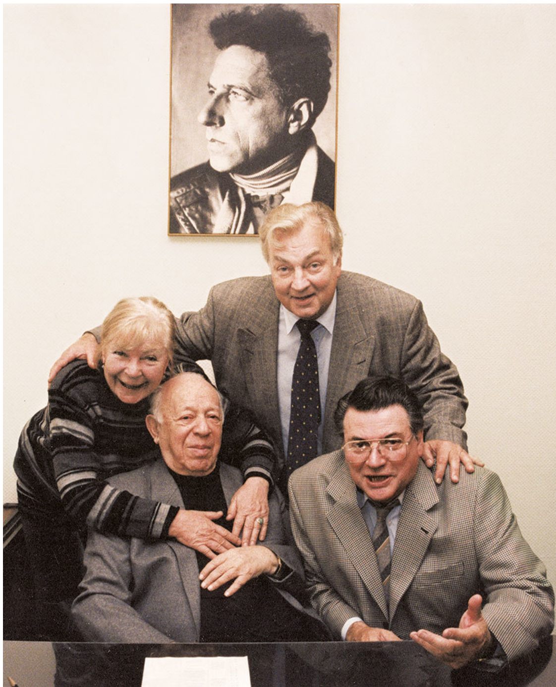
С Ольгой Аросевой, Валентином Плучеком и Михаилом Державиным

лизма нет, а есть только необходимость все время ориентироваться на 90-летнюю жизнь этого заведения и стараться быть (конечно, изображая это) патриотом.