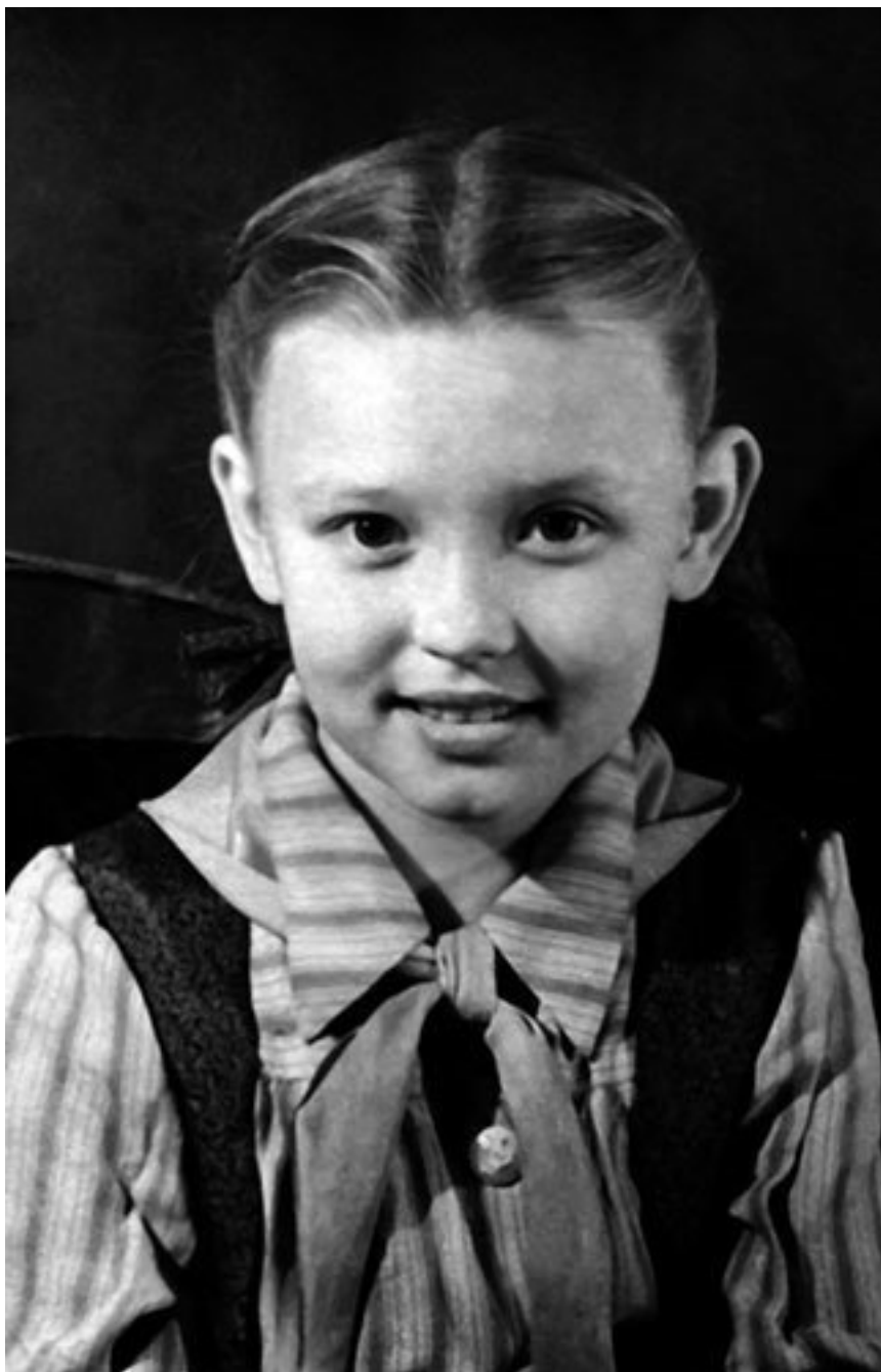
Вера Алентова в детстве.

«Мы росли, как трава во дворе. Моя мама была актрисой, но все свободное время подрабатывала в пошивочном цехе. Мой отец умер рано, когда мне было четыре года, и мама растила меня одна. Сегодня я понимаю, что мы – сами того не желая – нанесли урон вашему поколению. Мы, дети военного времени, росли в жутких условиях...»