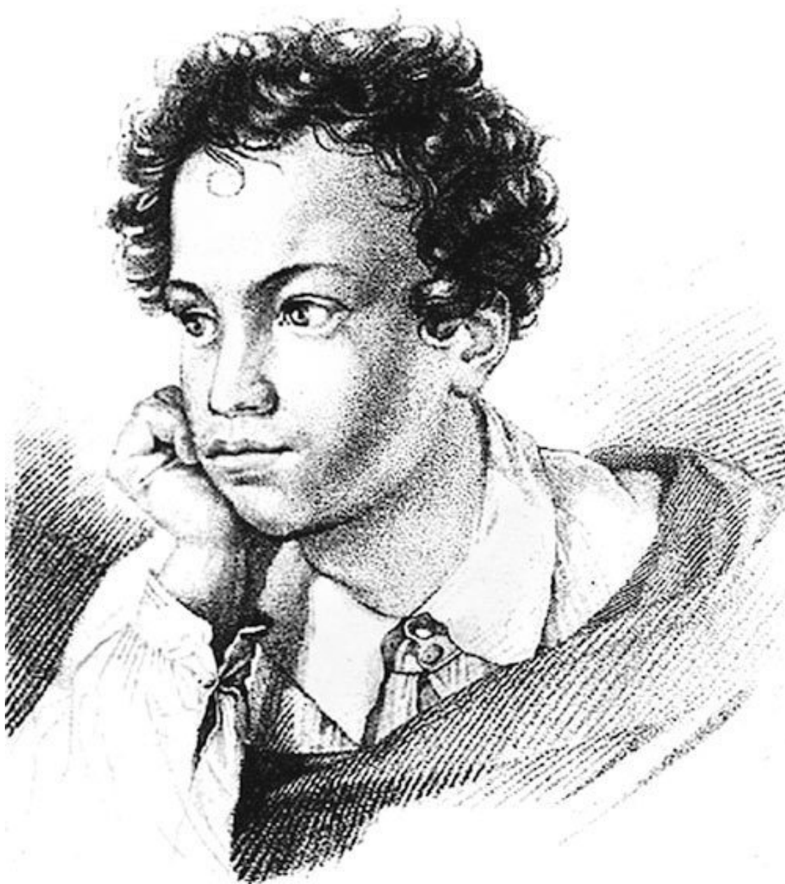
Портрет А.С.Пушкина. Гравюра на меди. Опубликовано в издании «Кавказский пленник» в 1822 г. в типографии А.И. Герча.

Великим быть желаю, Люблю России честь, Я много обещаю – Исполню ли? Бог весть!