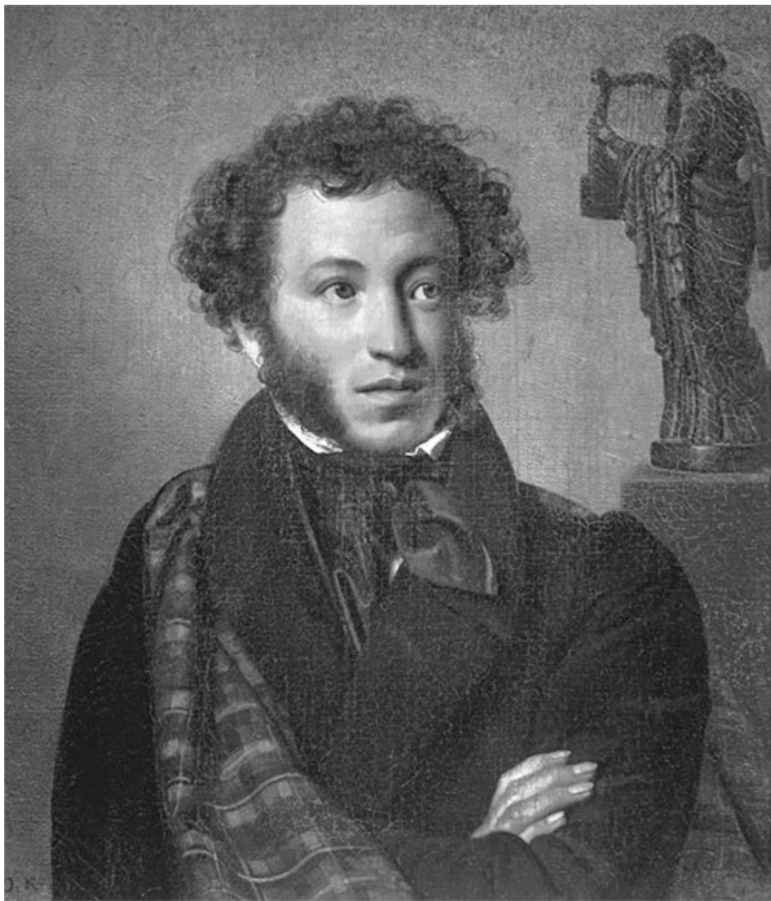
А.С. Пушкин. Художник О.А. Кипренский, 1827 г.

«...» Себя как в зеркале я вижу, Но это зеркало мне льстит «...»