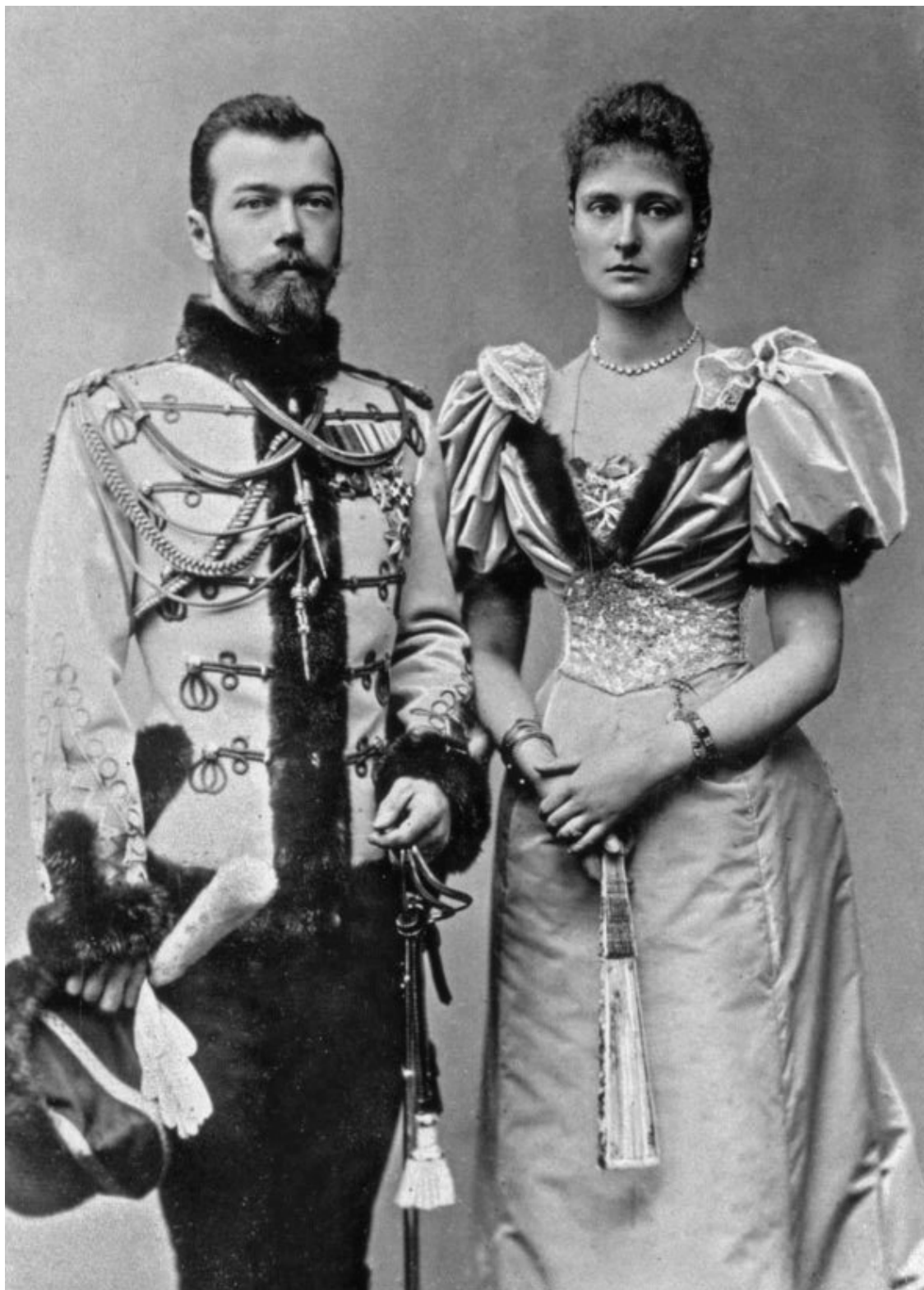
Император Николай II и императрица Александра Федоровна, 1896 г.

«Мнения могут расходиться на счет роли, сыгранной Императрицей во время царствования, но я должна сказать, что в ней Наследник нашел себе жену, целиком воспринявшую русскую веру, принципы и устои царской власти, женщину больших душевных качеств и долга» (М.Ф. Киесинская)