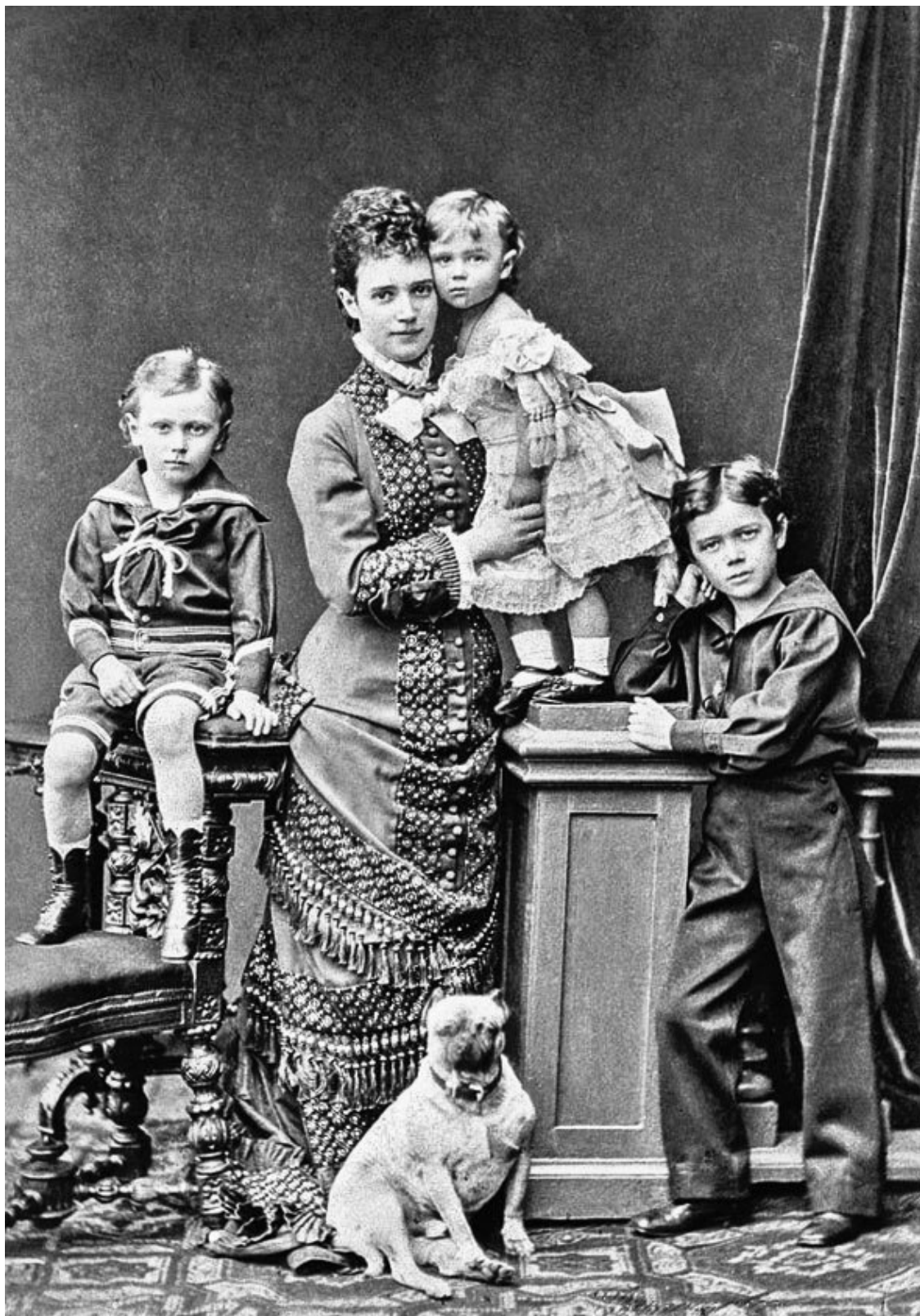
Цесаревна и великая княгиня Мария Федоровна с детьми и мопсом. Слева направо: Георгий, Ксения, Николай

После завт[рака] отправились в «Олимпию», где было замечательно. Джорджи, Мэй и Мэри [их дочь] приехали из Ольдершота в 12 часов. Они пробыли здесь у меня до часу дня, в то время как Аликс была в церкви, так как сегодня день Вознес[ения] Хр[истова]. Суф-