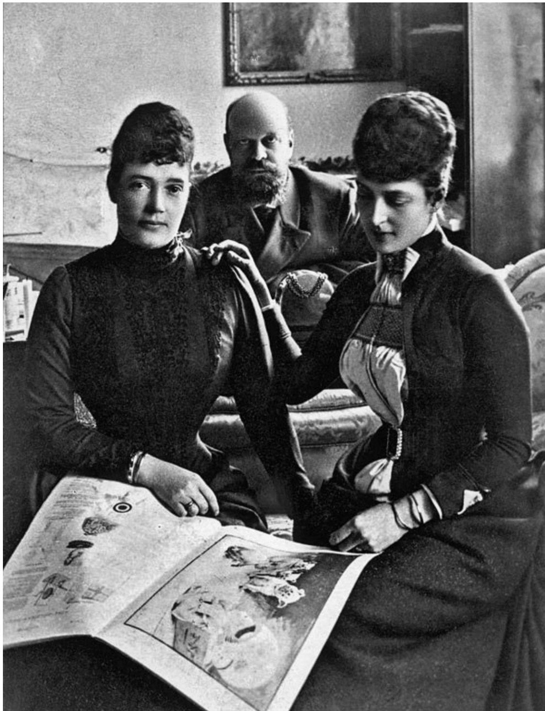
Императрица Мария Федоровна со своей сестрой Александрой и своим супругом российским императором Александром III