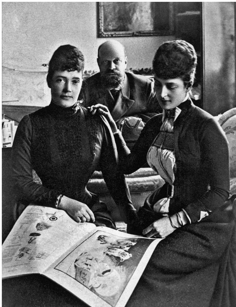
Императрица Мария Федоровна со своей сестрой