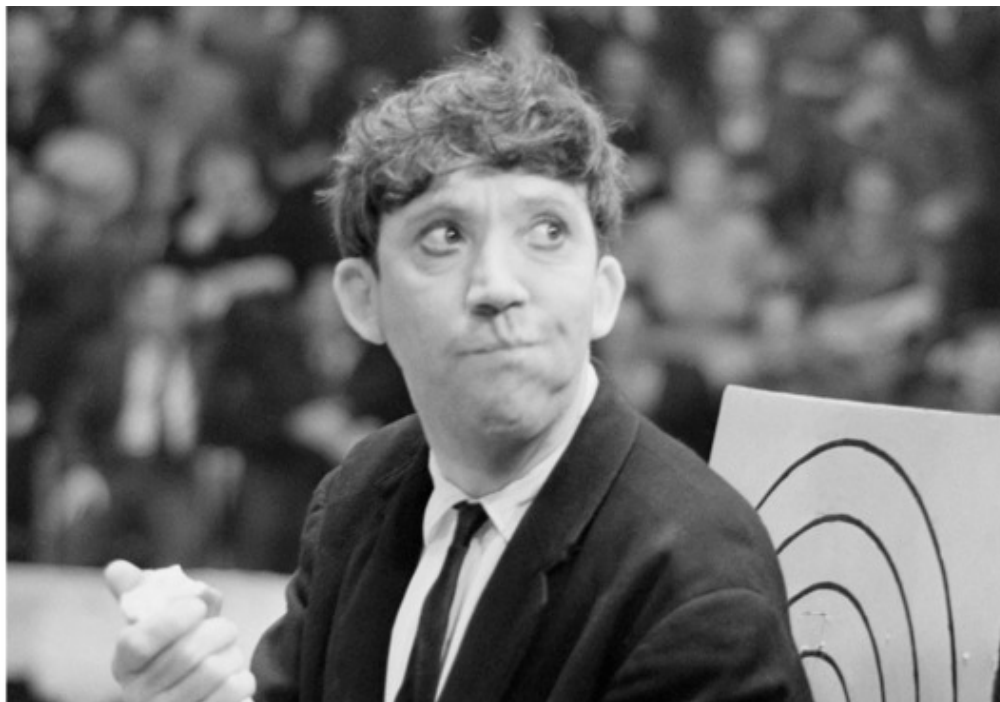
Юрий Никулин. 1962 год.

Курьер был прав. У меня было уже не три миллиона долларов, а чуть меньше. И, тем не менее, я почувствовал определенный позитив в сложившейся ситуации: рюкзак с баксами стал легче. Кроме того, у меня уже были нормальные доллары (старого образца). Была хорошая погода, светило солнце, и мне представился уникальный шанс посмотреть старую Москву.