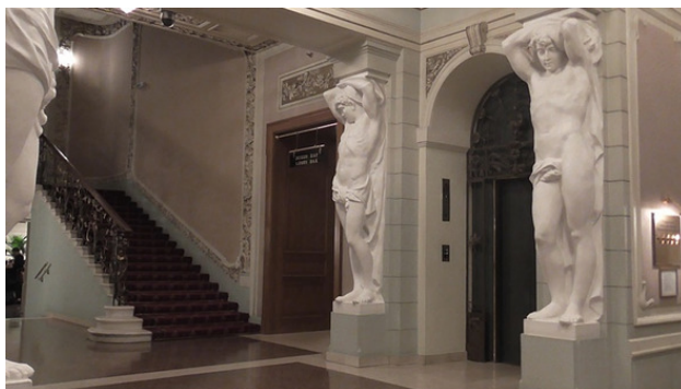
Москва, Гостиница Националь. Холл у лифта.

– Good afternoon, Hello, – сказал я с широкой улыбкой, глядя на симпатичную девушку за стойкой регистрации. Оказывается, и 50 лет назад в Москве были столь симпатичные девушки. По крайней мере, в интуристской гостинице в сердце Москвы, у самого Кремля.