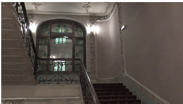
Лестница в гостинице Националь в Москве.

Спустя долю секунды я понял, что обнаружу себя, громко крича на чистом русском языке в холле одного из лучших отелей в СССР для иностранных туристов! Тут советских граждан быть не может. Да и русских почти нет, кроме, разве что, случайных туристов с российскими корнями, убежавших за границу еще в революцию 1917 года.