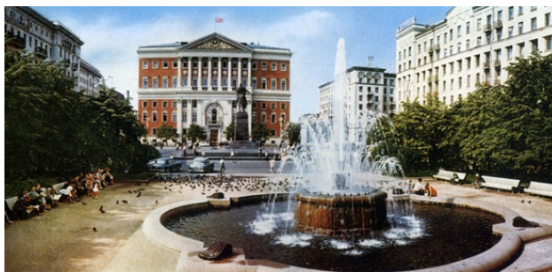
Здание Моссовета в Москве, 60-е годы. Сегодня в нем МЭРия.