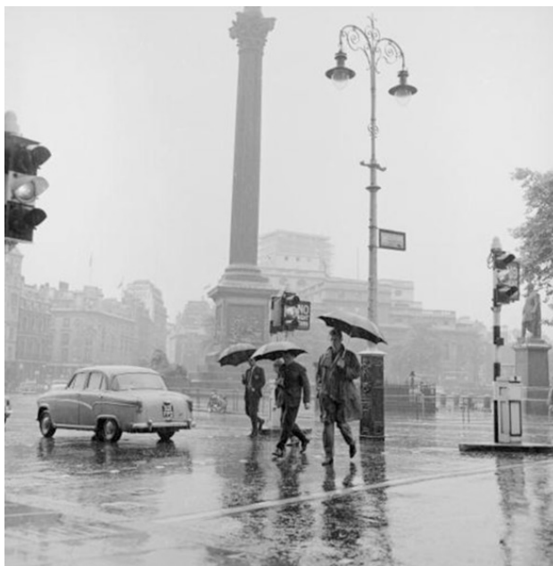
Дождь в Лондоне, 1962 год

Слово «Альбион», кстати говоря, произошло от латинского «альбус» – «белый», или от кельтского корня, означавшего «горы», «Альпы». Что же до определения «туманный», то оно обязано своим существованием прославленным густым морским туманам, постоянно окутывающим низменные части острова Великобритания.