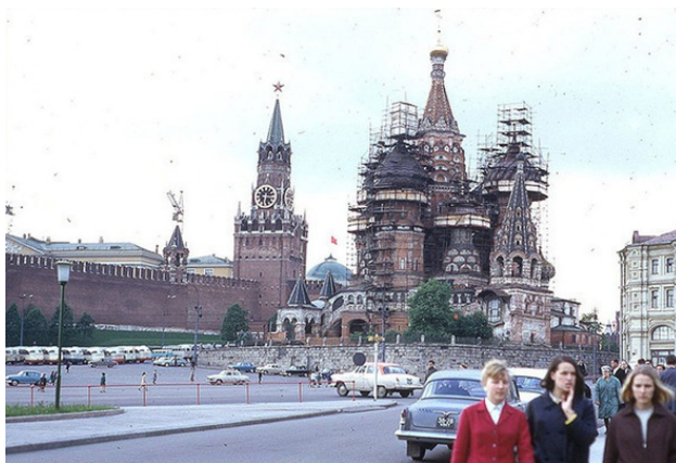
Москва, вид на Спасскую башню Кремля и Храм Василия Блаженного. 1963 год

С водой я решил вопрос там же, в общественном туалете. Попив холодной воды из-под крана, я удовлетворенно вышел на улицу, навстречу неведомым приключениям в старой Москве.