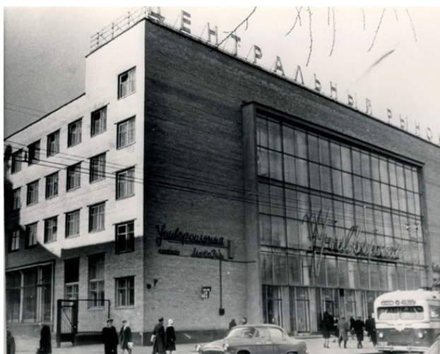
Цветной бульвар. Центральный рынок. 1962 год.

Станции метро «Цветной бульвар» на Цветном бульваре я тоже не увидел. Ее еще не было. Станцию откроют только в самом конце 80-х годов (в мае 1989 года).