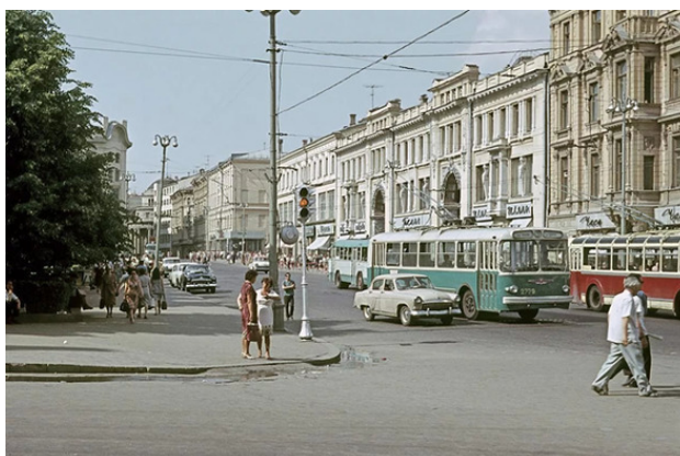
Улица Петровка, 60-е годы.

Надо бы купить любую газету или хоть взглянуть на дату свежих газет. Все же хотелось знать точнее, в какое время я попал. Впрочем, газетного киоска я пока не заметил. Денег на газету у меня еще не было, и кроме того, газета и знание точной даты, дня недели, месяца и года мне вряд ли могли оказать существенную помощь в размене валюты, поиске воды, еды и ночлега. А именно это было актуальным на ближайшие часы.