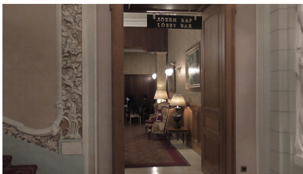
Вход в лобби-бар в гостинице Националь.

– Все гостевые карты у жены. Она скоро будет. Она сувениры пошла купить в ГУМ. Налейте виски с колой и дайте бутерброды с икрой. Очень буду признателен. С аэропорта ничего не пил и с утра не ел. Жена не успела нормальный завтрак приготовить. Опаздывали. У нас в Англии они все такие (жены), – сказал я с легким акцентом, многозначительно подмигнув бармену. Я протянул бармену банкноту в 100 долларов. – Сдачи не надо.