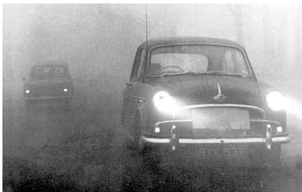
Туман со смогом в Лондоне. Конец 50-х, начало 60-х годов

Слово «Альбион», кстати говоря, произошло от латинского «альбус» – «белый», или от кельтского корня, означавшего «горы», «Альпы». Что же до определения «туманный», то оно обязано своим существованием прославленным густым морским туманам, постоянно окутывающим низменные части острова Великобритания.