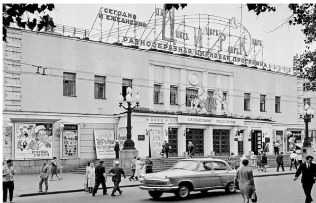
Цирк на Цветном бульваре 1965 год.

я понял, что попал в СССР. Притом, видимо, в 60-е годы. То есть лет на 50—55 примерно назад, в прошлое! В какой год или дату, я точно пока не знал. Народу на улице было немного. Рабочий день. При СССР народ больше работал.