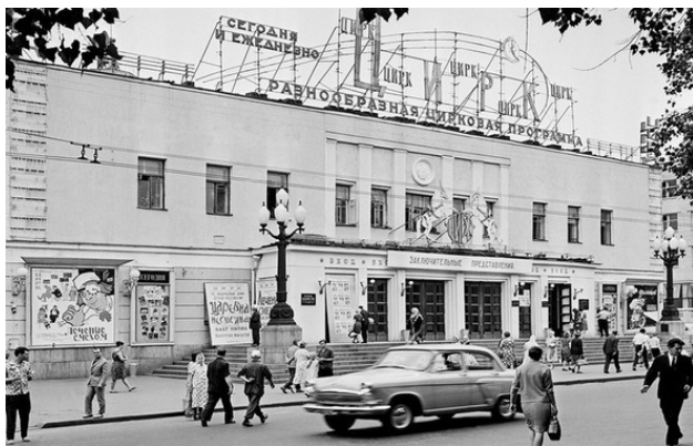
Цирк на Цветном бульваре 1965 год.

в прошлое! В какой год или дату, я точно пока не знал. Народу на улице было немного. Рабочий день. При СССР народ больше работал.