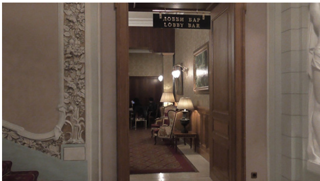
Вход в лобби-бар в гостинице Националь.

– Все гостевые карты у жены. Она скоро будет. Она сувениры пошла купить в ГУМ. Налейте виски с колой и дайте бутерброды с икрой. Очень буду признателен. С аэропорта ничего не пил и с утра не ел. Жена не успела нормальный завтрак приготовить. Опаздывали. У нас в Англии они все такие (жены), – сказал я с легким акцентом, многозначительно подмигнув бармену. Я протянул бармену банкноту в 100 долларов. – Сдачи не надо.