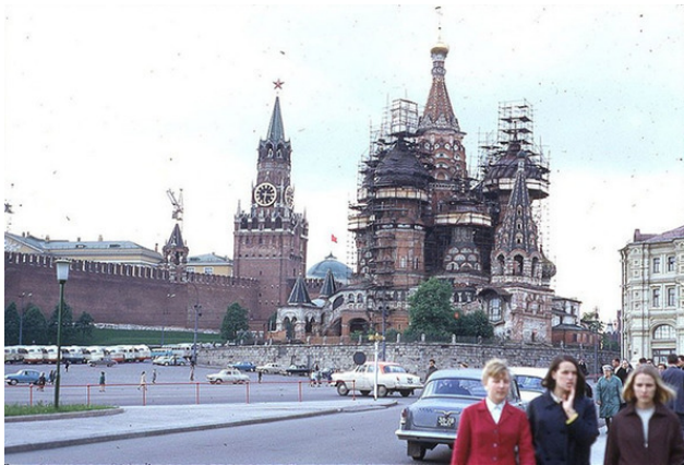
Москва, вид на Спасскую башню Кремля и Храм Василия Блаженного. 1963 год