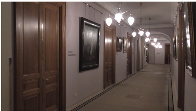
Коридор гостиницы Националь.

хотите снять номер на свое имя, – широко улыбнувшись, ответила администратор. – Но вы можете подождать вашу жену в нашем баре.